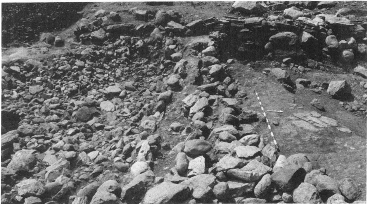
Abb. 1: Feld 5, nach 14. Abstich; Steinreihen des Horizontes E 1 (Bildmitte), Herd 20 (rechts) und Sickerbett oder Steinaufschüttung (links)

In Feld 5 wurden im 12. bis 14. Abstich die Überreste der Kulturschicht der Horizonte D und E abgebaut. Diese Kulturschicht enthielt viel rötlichen Brand und Holzkohle und eine beträchtliche Menge an verkohlten Vegetabilien.