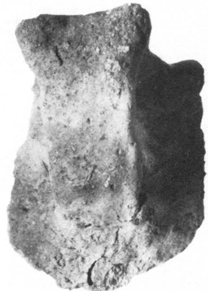
Abb. 5: Gefässhenkel vom Typus der «ansa ad ascia»

Der wohl bedeutendste Fund der Kampagne 1980 bildet eine vollständige, allerdings durch Hitzeeinwirkung stark beeinträchtigte Klinge eines bronzenen geknickten Randleistenbeiles (frühe Mittelbronzezeit). An weiteren interessanten Neufunden wurden eine bronzene Nähnadel, eine grosse Bernsteinperle, eine sehr schön gearbeitete beinerne Pfeilspitze, eine Knochenperle, ein kleiner Steinring, weitere fragmentierte Bronzeobjekte und verschiedene Stein- und