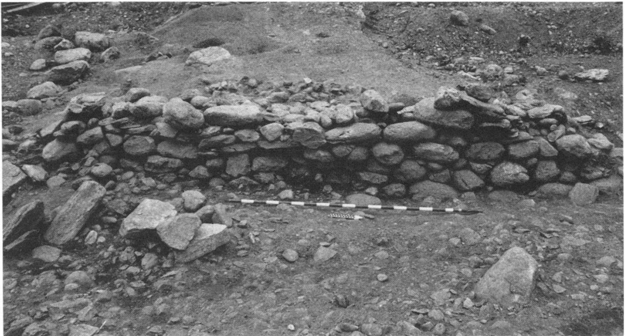
Abb. 3: Profilbrücke zwischen Feld 2 und 3, nach 9. Abstich; «Terrassierungsmauer» M 29/31

Eine neu entdeckte Herdstelle 29/30 lässt sich vorläufig nicht eindeutig einem Horizont D oder E 1 zuweisen. Interessant ist in dieser Schicht ein Holzkohlekomplex von mehreren, parallel zueinander verlaufenden Rundhölzern mit lehmigen Resten zwischen den einzelnen Hölzern; unseres Erachtens handelt es sich dabei um die verstürzten Überreste eines abgebrannten Holzhauses, wohl eines Blockbaues. Wertvoll ist dieser Befund vor allem deshalb, weil er