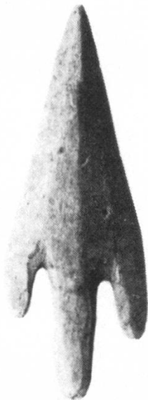
Abb. 4: Pfeilspitze aus Knochen

Auch in der Profilbrücke zwischen den Feldern 1 und 2 wurden drei Feldabstiche durchgeführt. Ausser einigen mauerartigen, aber nicht klar definierbaren Steinreihen wurde lediglich die Oberkante des grossen Steinbettes freigelegt und bereits teilweise abgebaut. In diesem Steinbett glaubten wir früher schon eine Planier- und Auffüllschicht, die unmittelbar nach dem Brande des Horizontes D aufgeschüttet wurde, sehen zu dürfen. Auf der Profilbrücke zwischen den Feldern 2 und 3 wurde zunächst ein Teil der Befunde des Horizontes D abgebaut (M 27a, M 60 und M 63), während die «Terrassierungsmauer» M 29/31 besser freigelegt werden konnte. Während man westlich von M 29/31 bereits auf den anstehenden Moränenkies stiess, kam östlich dieser Mauer wieder eine dunkle, stark brandhaltige Kulturschicht zum Vorschein, wohl zu Horizont E 1 gehörend (vgl. bereits Feld 6).