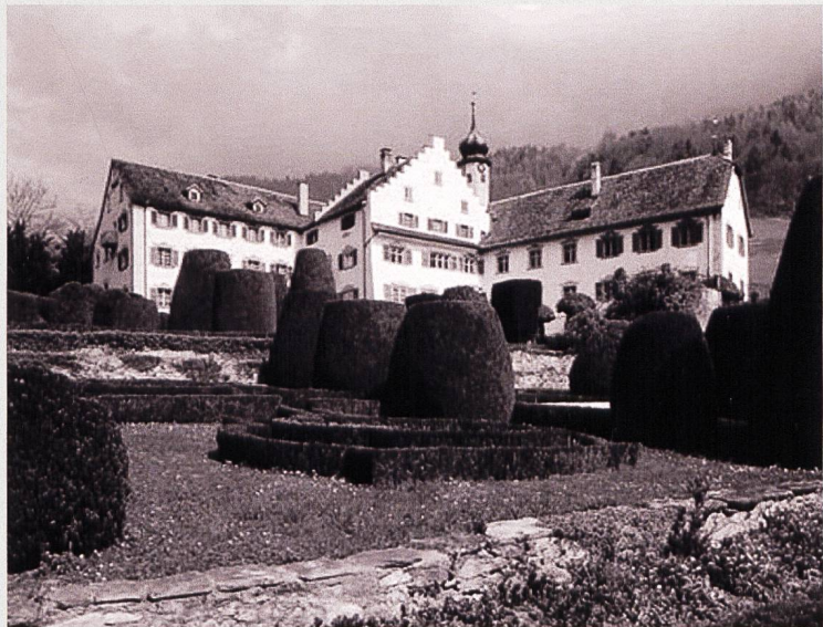
Abb. 5: Schloss Bothmar, Malans, 1958. ( http://www.baukultur.gr.ch/de_DE/address/schloss_bothmar.24590 )

Die Bergüner Kopialbücher und Akten gelangten, zusammen mit Rechnungsbüchern über die Bergüner Güter der Planta-Salis, über mehrere Erbgänge in den Besitz der Familie Salis-Seewis im Schloss Bothmar in Malans. 1988 übergab die Familie das gesamte Familienarchiv dem Staatsarchiv Graubünden. Dort bin ich im Rahmen meiner Recherchen über Bergün im 17. Jahrhundert auf die Hexenprozessakten gestossen. Die Bergüner Akten gehören also in die Kategorie «Zufallsfunde».