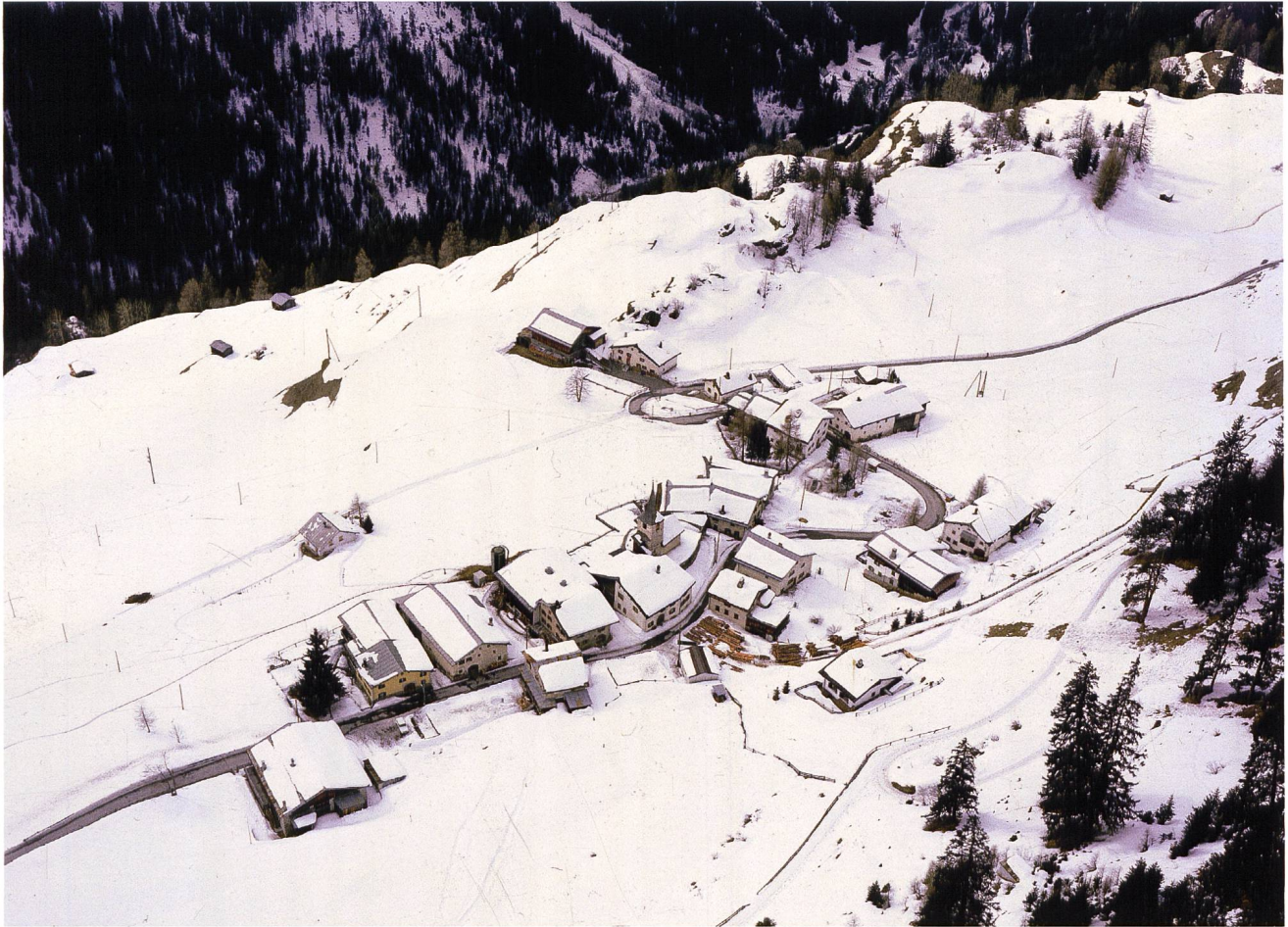
Abb. 3: Stuls bei Bergün, 1986.