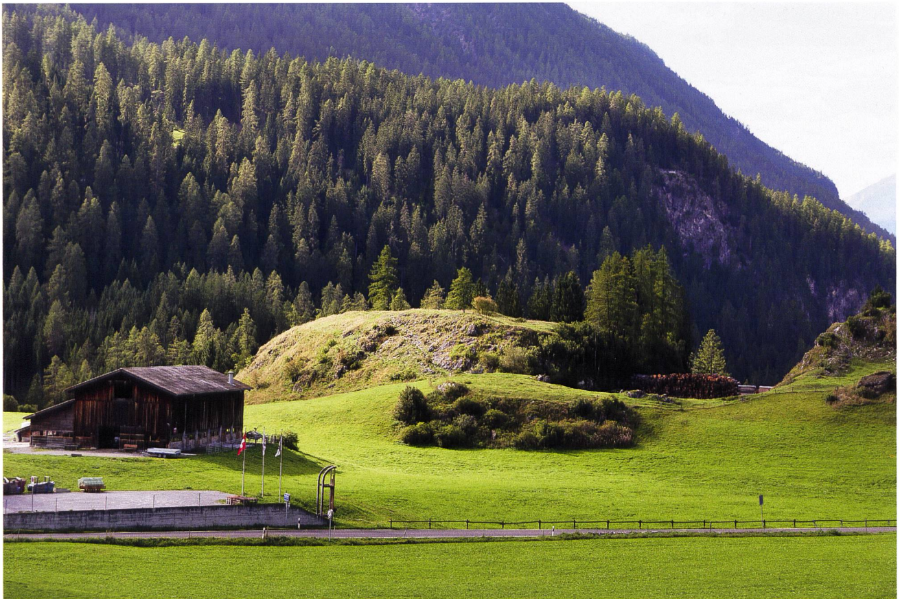
Abb. 6: Der Galgenhügel in Bergün (Fuorchas).