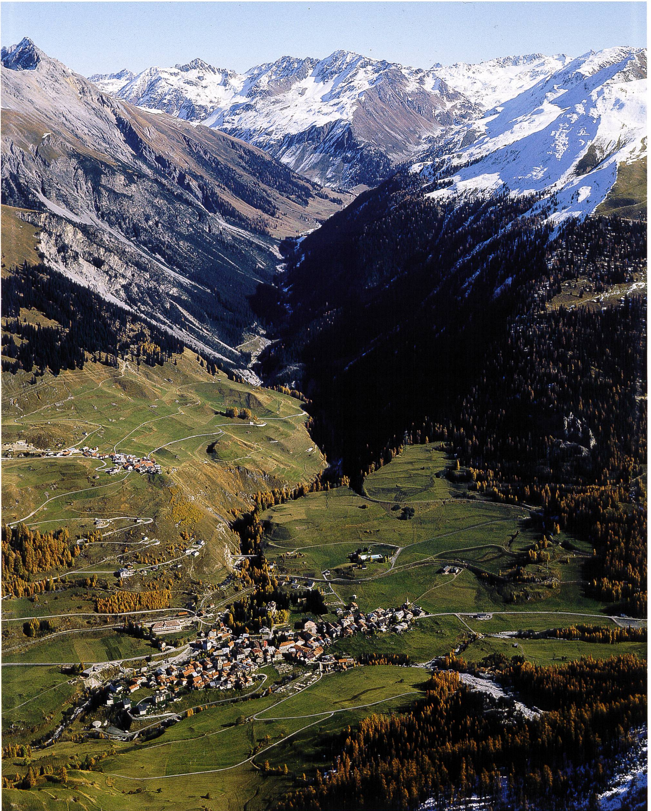
Abb. 1: Blick auf Bergün und Latsch, 1975.