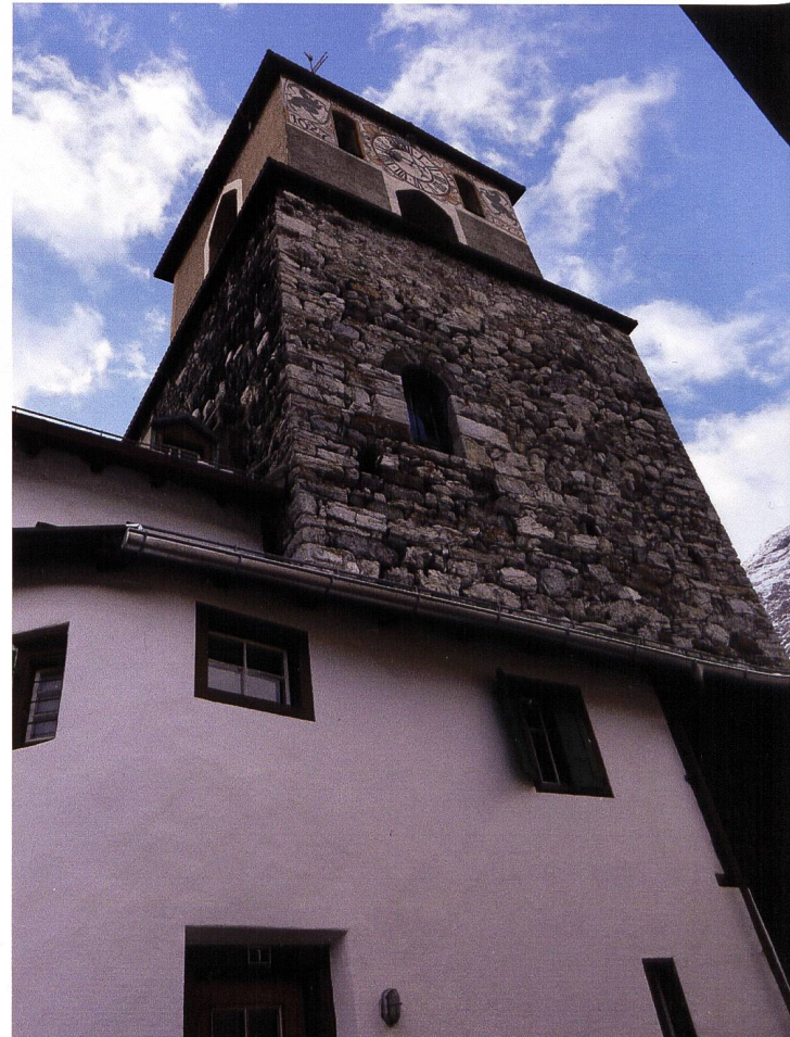
Abb. 7: Der Turm von Bergün, wahrscheinlicher Schauplatz der Prozesse.