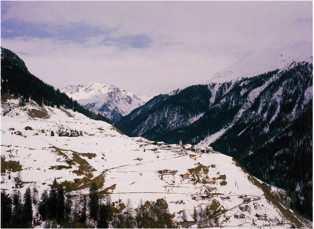
Abb. 2: Latsch bei Bergün, 1986. (ETH-Bibliothek Zürich,)