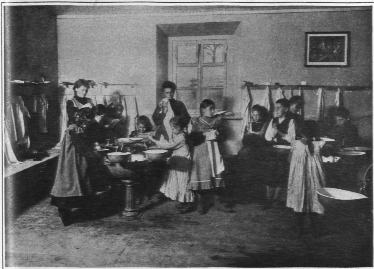
Erholungsstation Schwäbrig. Bei der Toilette.