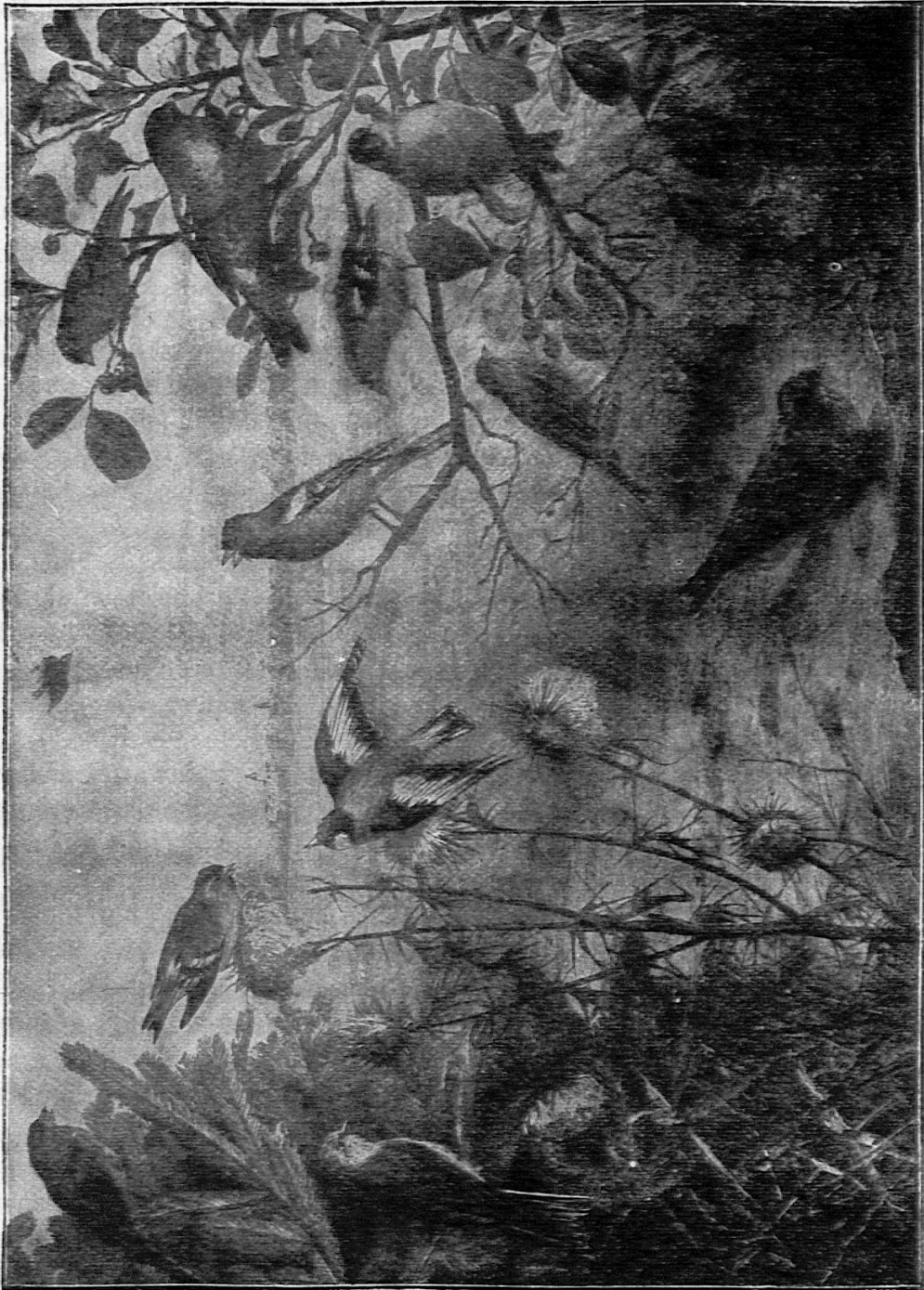
Wandtafeln zur Tierkunde, herausgegeben vom Kosmos.

Eine neue Veröffentlichung des Kosmos! Wie seine früheren Unternehmungen verfolgen auch diese Wandtafeln zur Tierkunde den Zweck,