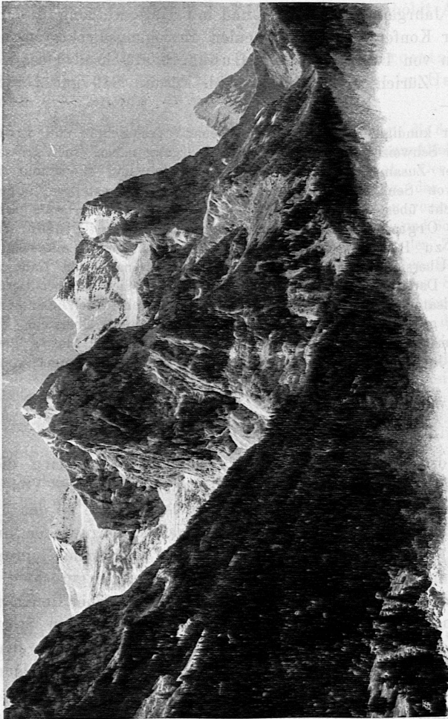
Well- und Wetterhörner. (Wehrli & Cie., Kilchberg-Zürich.)

Vaterlande war es vor allem die Kunstanstalt J. E. Wolfensberger in Zürich, die mit namhaften Opfern sich der neuen Be-