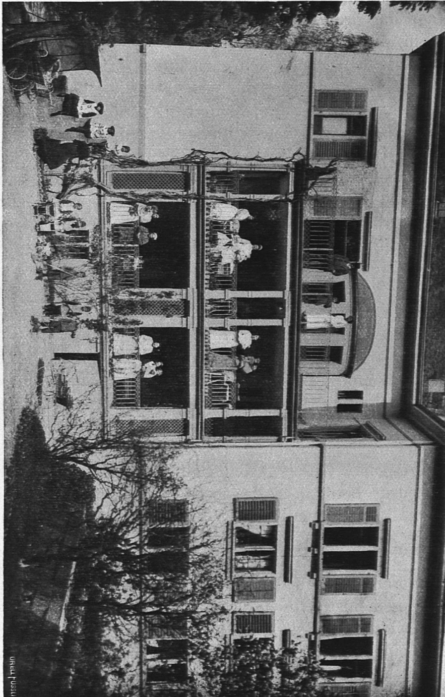
Das städtische Jugendheim: Gebäudeansicht mit Terrassen.

Die Kurse sollen sich selbst erhalten und weder öffentliche noch private Mittel in Anspruch nehmen. Es wird deshalb von jeder Teilnehmerin ein Kursgeld von Fr. 100.— erhoben, das