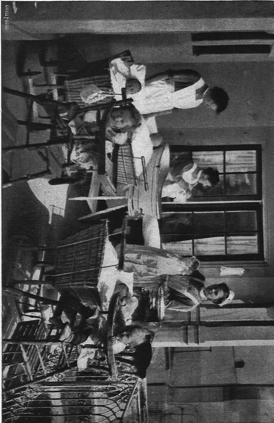
Das städtische Jugendheim : Bei den Kleinen.

Zur praktischen Ausbildung gehört auch der Handarbeitsunterricht, die Anleitung bei Fröbelschen Beschäftigungen, Papierarbeiten, Modellieren, Körbchenflechten und Anfertigen von Spiel-