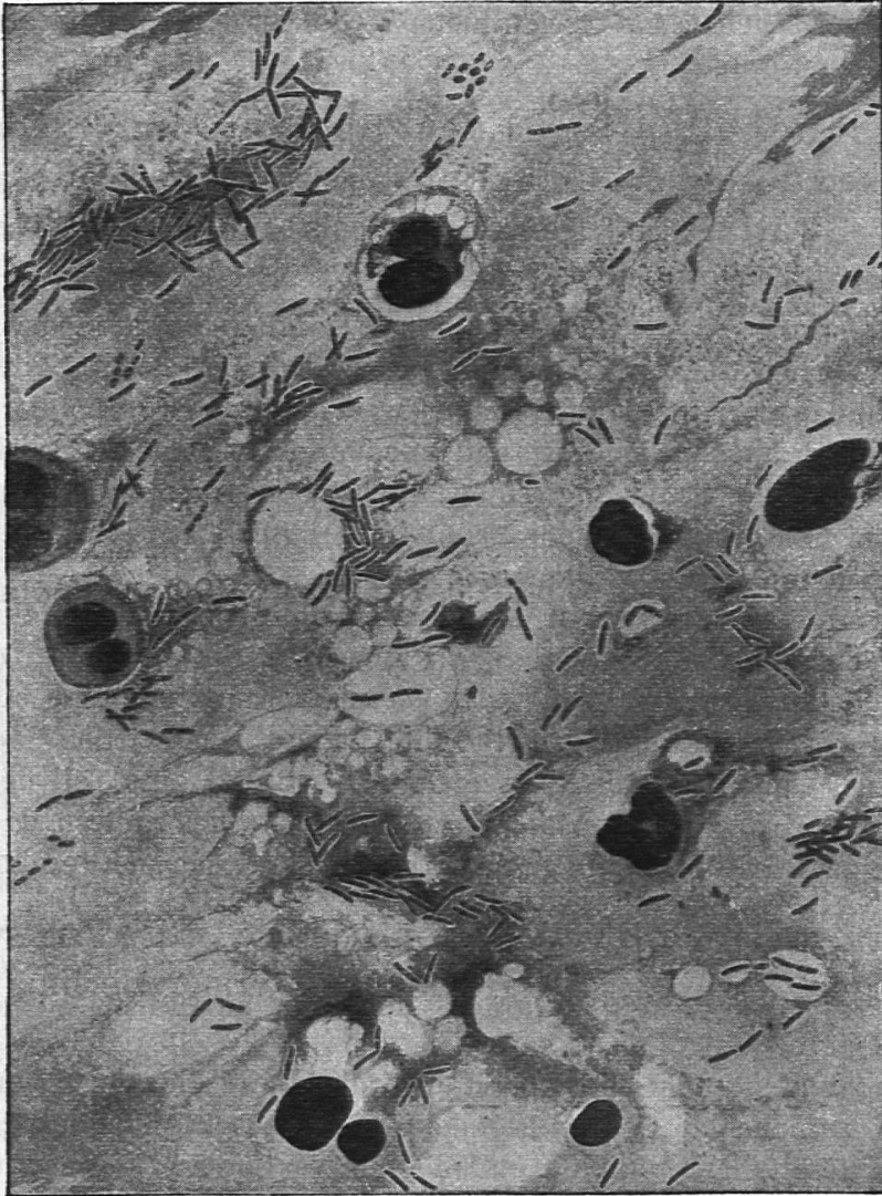
Wandbilder von Dammann und Seebaum. Tafel III.

bläschen. Ein anderes Wandbild (III) verdeutlicht naturgetreu die große Zahl von Bazillen im Auswurf eines Schwindsüchtigen und kennzeichnet zugleich die Form und Gestalt der Erreger der Tuberkulose. Die letzte Tafel beweist an Hand einer Kurve die Abnahme der Sterblichkeit an Schwindsucht seit dem Jahre 1879. Die Tafeln geben die wirklichen Verhältnisse naturgetreu wieder, Kunst und Natur haben sich hier in ausgezeichnete Weise vereint. Es wäre