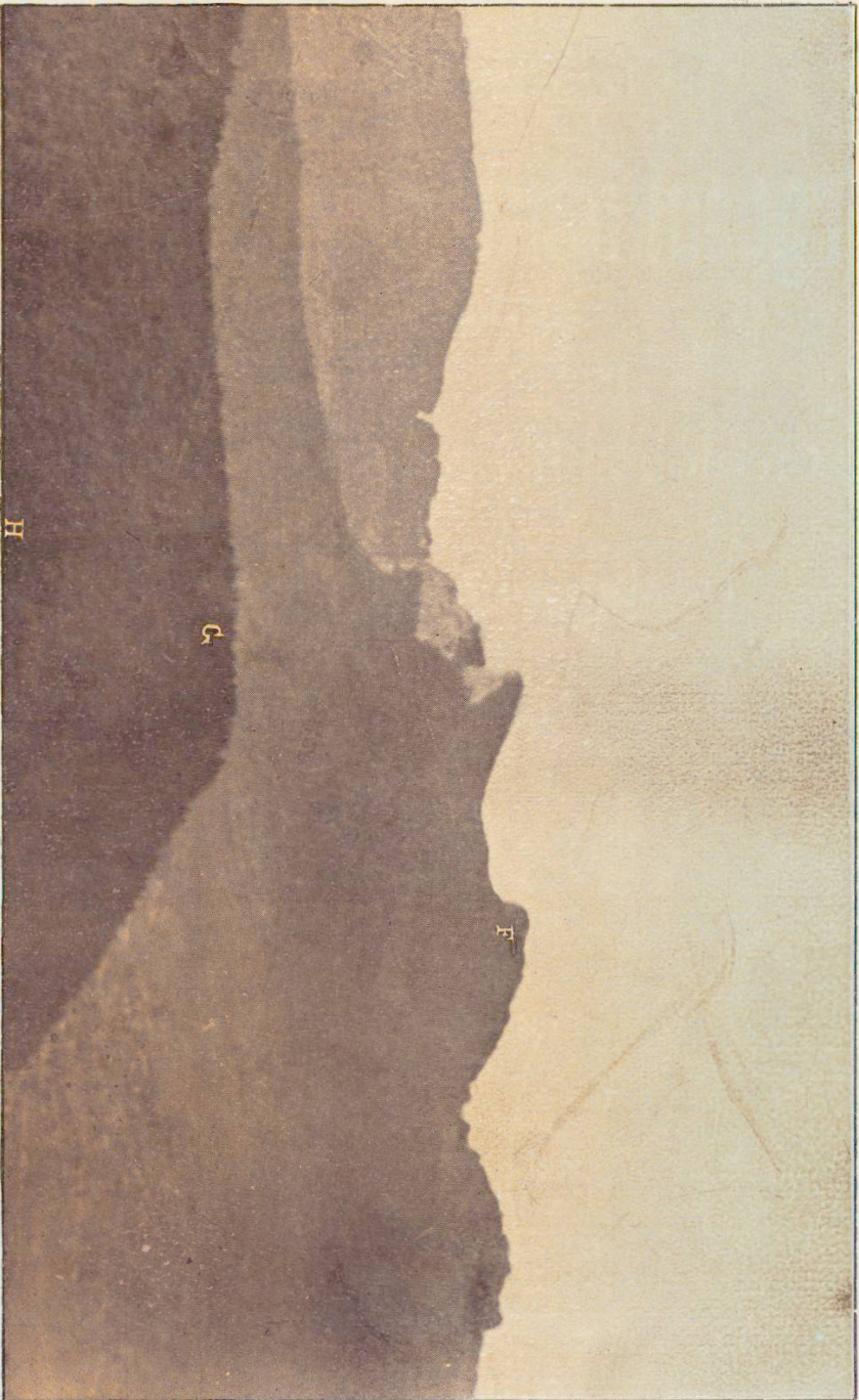
Umgebung von Olten. Aus der Bronzezeit.