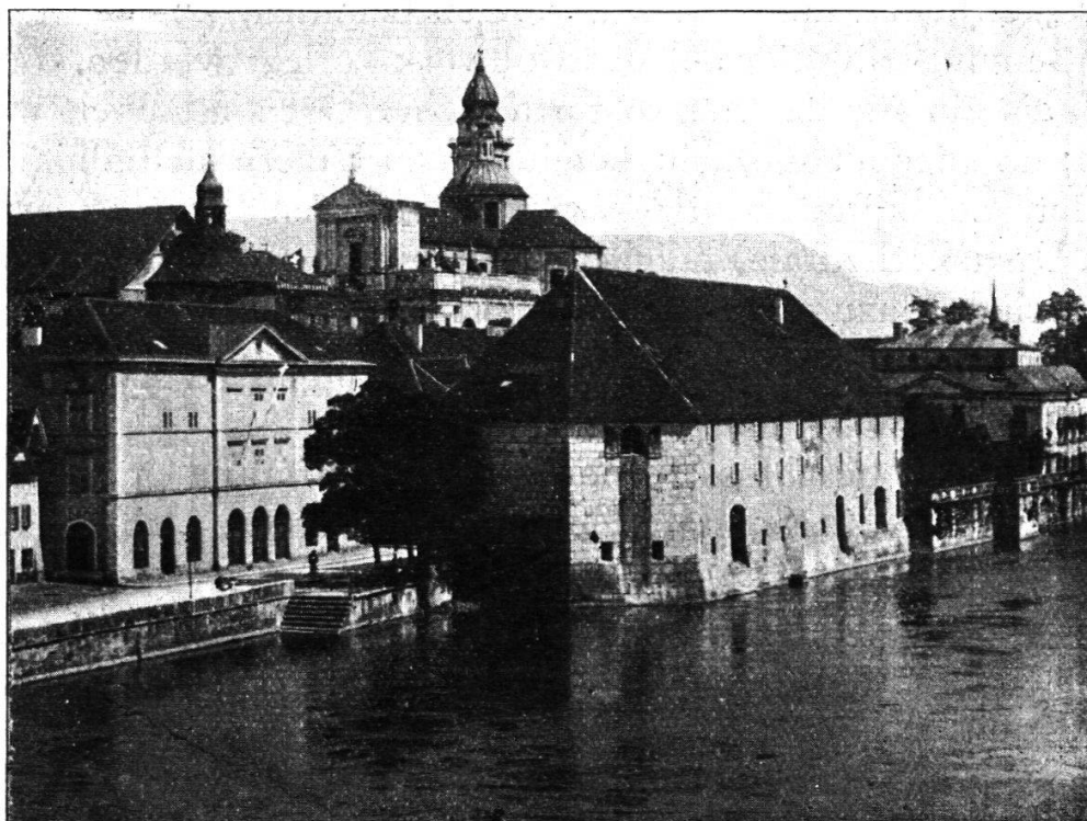
Das Landhaus in Solothurn (1722) im heutigen Zustand.

gerschaft zu erbauen“. 1) Ein späteres Gebäude dieser Art stammt aus dem Jahre 1640, wie denn Haffner berichtet: „Das neue Kaufhaus allhie unten an der Schaalgasse, oder Land, ist dies Jahr 1640 vollendet; die Baukosten belaufen sich auf 6116 Pfd., 13 Schilling, 8 Pfennig“. 2) Das heute noch stehende Gebäude stammt aus dem 18. Jahrhundert und trägt die Jahrzahl 1722. Zur innern Einrichtung des neuen Gebäudes erstattete die Zollkammer dem Rat folgendes Gutachten vom 25. Mai 1770: 3)