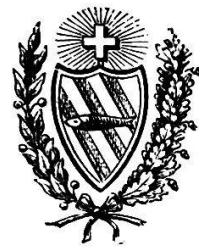
Derendinger Wappen 1909. Druckerei Ch. Habegger.