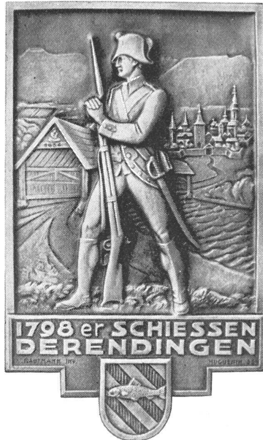
Derendinger Wappen 1939. Kranzabzeichen des 1798er Schiessens.