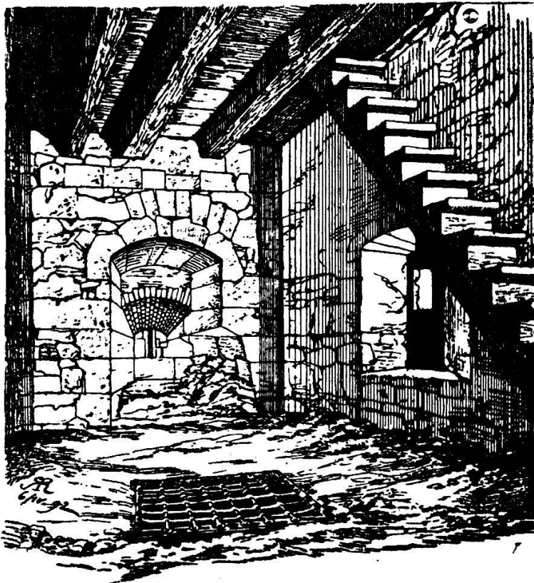
Inneres des Krummturms mit Eingang ins Verliess (nach Rahn).

Im Fussboden öffnet sich das Einsteigeloch zu dem im Unterbau befindlichen Verliess, über dem sich eine im Scheitel 0,26 Meter starke Flachtonne in Backstein befindet (Rahn).