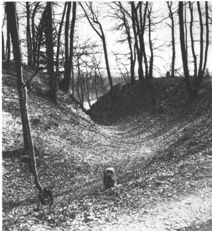
Biberist, Halsgraben des Burghubels

auszuebnen oder gar zu erhöhen. Im West-Ost-Schnitt zeigte sich, dass diese Bodenanlage von der Mitte des Plateaus bis zum östlichen Rand reicht. Mauern waren nirgends aufzufinden. Der Zwingherrenhubel dürfte eine Erdburg aus dem Mittelalter sein. Aus dieser Zeit stammen auch die Funde. Keramik wurde auf der Terrasse in der Humusschicht von 17 cm Tiefe an abwärts bis an die untere Grenze der Sandstein-Bsetzi gefunden. Die Scherben sind rotgelb bis grauschwarz. Über der künstlichen Steinschicht lagen einige Eisenreste von handgeschmiedeten, zum Teil vierkantigen Nägeln. Unter den geborgenen Knochen war ein Kieferstück mit zwei Backenzähnen und ein Hauer eines Schweins, ein Metatarsusknochen und eine Rippe eines Rindes und die rechte Tibia eines Hundes. In den Schnitten des Grabens waren keine Funde.