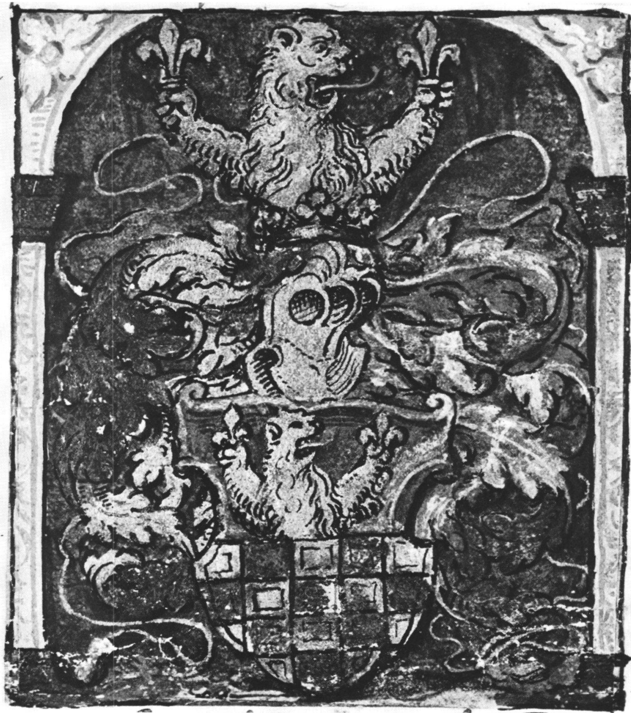
Urs Zurmattens Wappen im Adelsdiplom, 1570 (Staatsarchiv Solothurn)