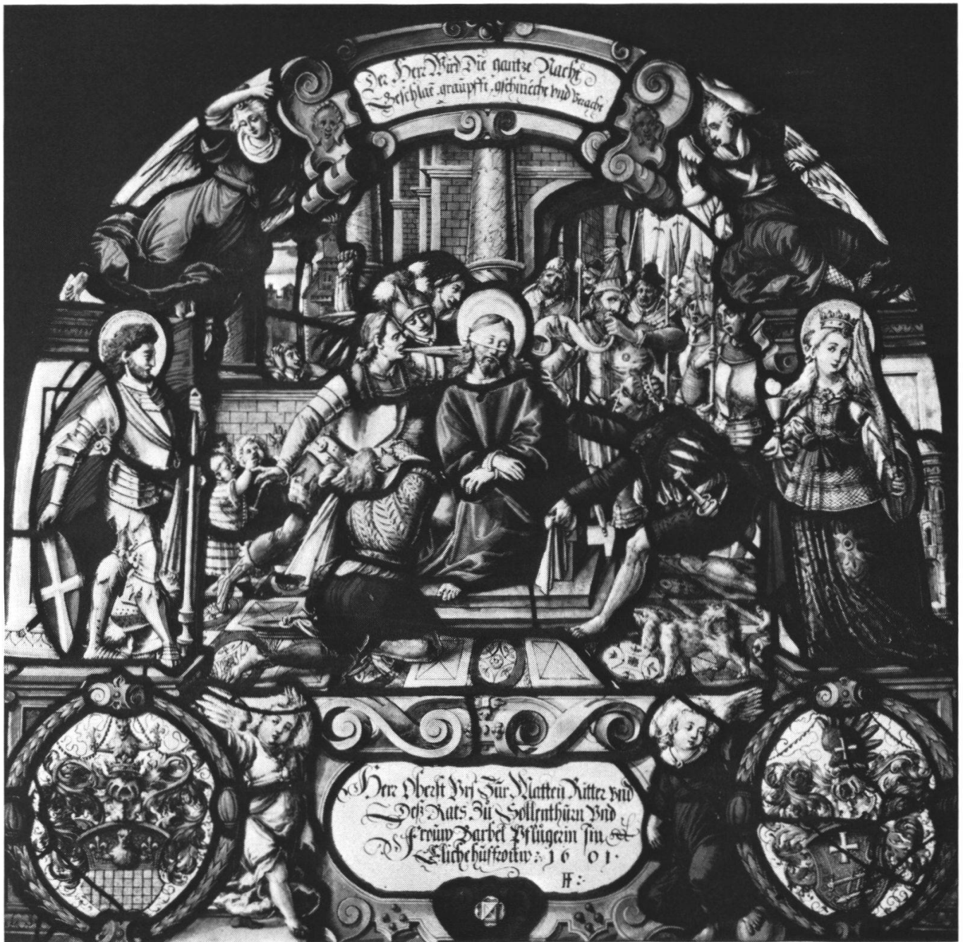
Urs Zurmattens Wappenscheibe, ins Kloster Rathausen gestiftet, 1601