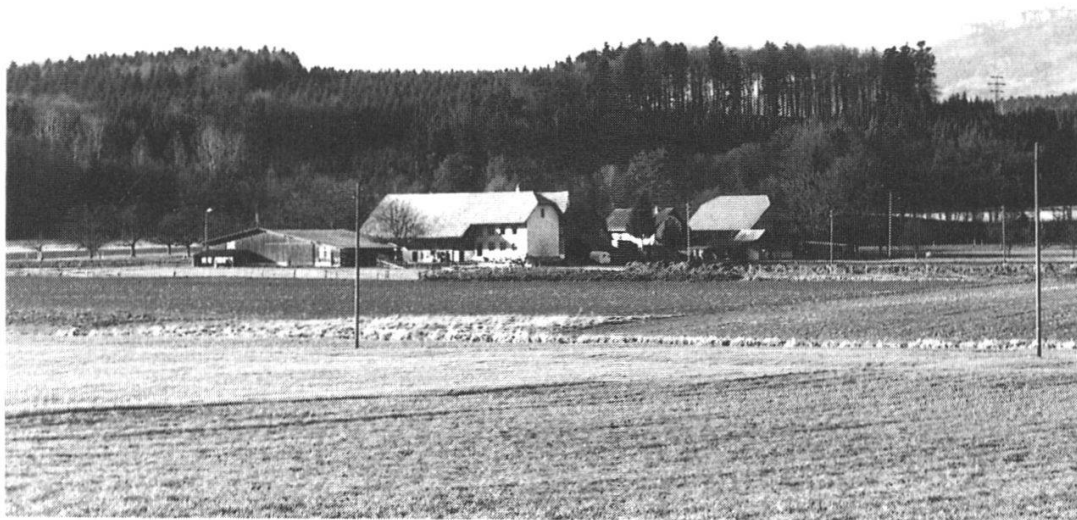
Abb. 1: Drei Höfe bilden heute den Wolfwiler Weiler Oberer Schweissacher. Sie liegen im Grenzgebiet zum Kanton Bern und am Rande eines mächtig nach Norden ausholenden Aare-Totarmes. Im Vordergrund das landwirtschaftlich nutzbar gemachte eis- und nacheiszeitliche Flussbett.

Item so ist undergange 4 und ussgemarchot, zwüschem den Herschaff- tenn Bächburg unnd Bipp, unnd vacht die erst march an In dem wyer zuo Fulennbach in der lutrenn butinenn, unnd gat grad 5 durch den wyer hinuber zuo der Eich, da der marchstein under dem Rein by dem wyer stat, ...» 6