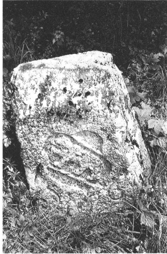
Abb. 2: «Nachfahren» der beschriebenen Herrschafts-Grenzsteine: links der Dreiangelstein aus dem Jahre 1764 nahe der Kantonsstrassengabelung beim Weiler Grossweier, 1470 als « zuo der grossenn Eich... zunächst ob dem ober stäg » lokalisiert; rechts der womöglich noch ältere Kantonsgrenzstein Nr.162 bzw. 426 am Kestenholzer Weierrain, 1470 als bei « der Eich... under dem Rein by dem wyer » bezeichnet. Dazwischen lag die « lutre buttine ».

Hier ist von höchster Staatsgewalt beider Aarestädte bestätigt, wo 1470 die Herrschaft Falkenstein endete und die Herrschaft Bechburg begann, nämlich in der « lutren buttinen in dem wyer zuo Fulennbach ». Damit ist aber auch ein zweites amtlich beurkundet: Was später der « Grosse Weier » oder « Grossweier » hiess, nannte man damals nach dem Bach, der diesem Weiher entsprang, mundartlich somit nach dem « fule Bach », d.h. nach dem träge dahinfließenden Bach, der aus dem Weiher im Raum des Weilers Grossweier, zwischen Schwarzhäusern und Wolfwil gelegen, seinen Anfang nahm und auf seinem Lauf zur Aare der Siedlung Fulenbach, fast 5 Kilometer östlich davon, den Namen gab. Die Formulierung « wyer zuo Fulennbach » zeigt sehr schön auf, wie das Quellgebiet des Fulenbaches, wohl gemäss der Lex Alamannorum, während des Mittelalters für die Wasserversorgung der Siedlung Fulenbach rechtlich gesichert und deshalb auch nie zu Kestenholz und nur vereinzelt zu Wolfwil, sondern immer – rechtlich! – « zu Fulenbach » gezählt wurde, obwohl