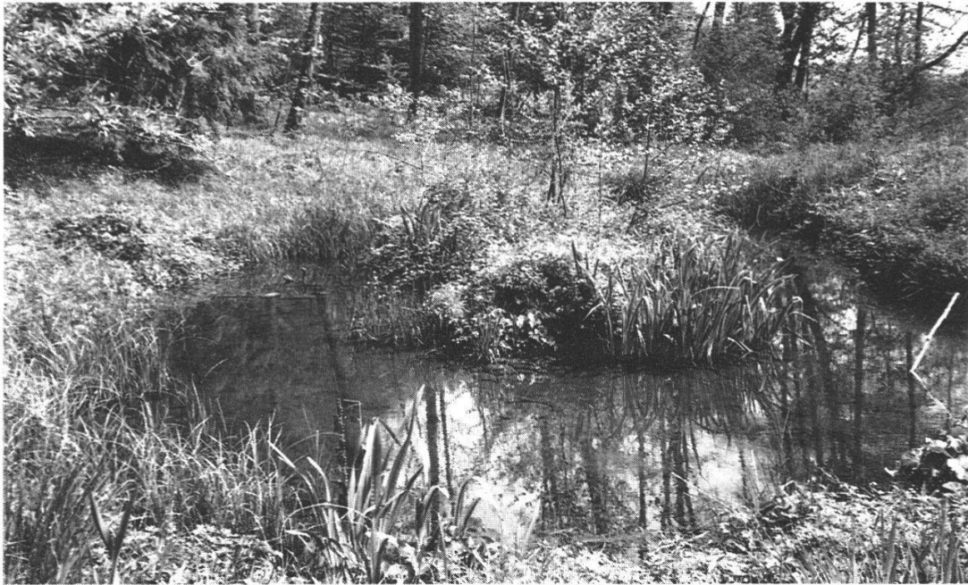
Abb. 11: Das Kestenholzer Naturschutzreservat heute: der letzte Rest des Grossweiers ...

Quellgebiet des Fulenbaches barg der Grosse Weier zumindest während seiner grössten Ausdehnung alle ihn speisenden Quellen auf seinem Grund, nämlich die erwähnten Grundwasseraufstösse. Drei grössere davon lagen auf solothurnischem Gebiet (s. Abb. 3). Ein weiterer Aufstoss befand sich im bernischen Teil des Weihers südlich der Kantonsgrenze. 84 Sie alle erhielten wahrscheinlich ihr « Kaltwasser » von einem unterirdischen Abfluss aus dem westlichen Teil des rund 20 bis 25 Meter höher gelegenen Gäuer Grundwasserstromes. 85 Diesen Grundwasser-Abfluss muss man sich als Überlauf über eine unter den Schottern liegende Molassekante vorstellen. Vorausgesetzt diese Vermutung werde einst bestätigt, floss das Grundwasser – und es fliesst in verminderter Menge noch heute – wahrscheinlich durch die Hochterrassenschotter des Mittelgäuer Höhenrückens hindurch und speist seit 1905 auch die Trinkwasserversorgung der Gemeinde Kestenholz (s. Abb. 12). Eine diesbezüg-