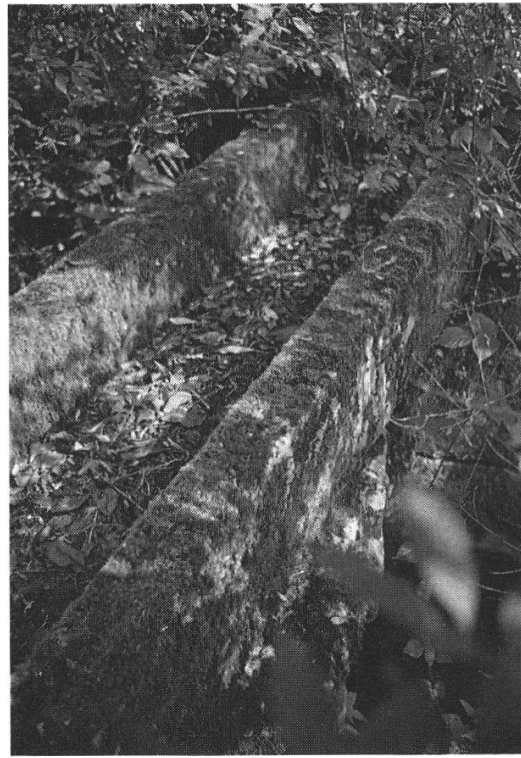
Abb. 10: Zwei Zeugen vergangener Zeiten: Links: Das kaum noch beachtete Überbleibsel des einst ebenfalls beachtlichen Kleinen Weiers auf Berner Gebiet wird heute von den Anstössern « Plumpe » genannt und steht unter bernischem Naturschutz. Rechts: Über dem Abfluss, dem jungen Moosbach , verbirgt sich im Gestrüpp noch heute ein Schieberbrücklein. Darüber führt ein steinerner Wässerkännel von 1886.