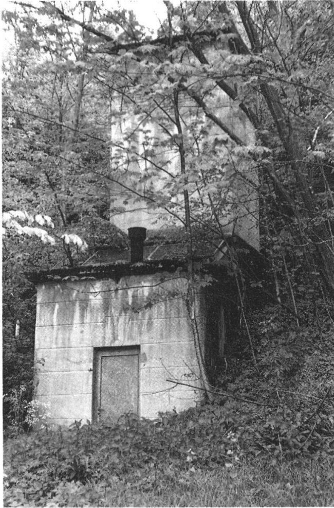
Abb. 12: Das Pumpenhaus der Einwohnergemeinde Kestenholz am Weirrain: ein rätselhafter Grundwasserstrom speist es.