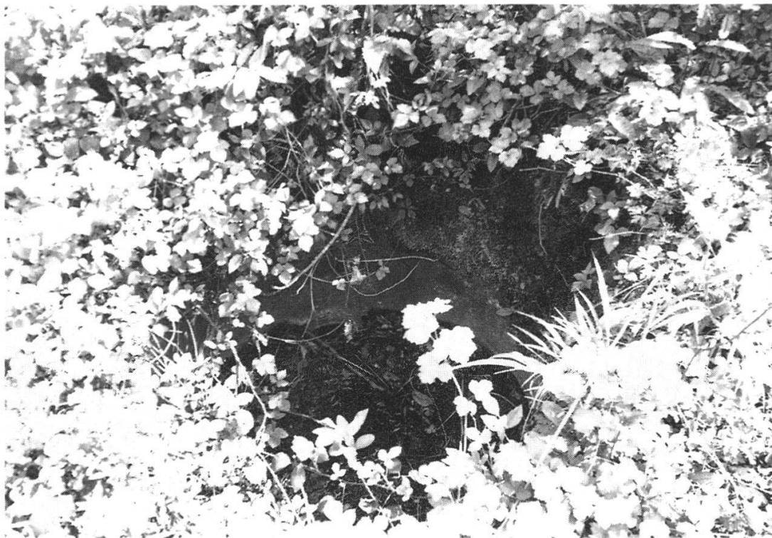
Abb. 13: Erste gemeinsame Wasserfassung der Gemeinden Wolfwil und Fulenbach im «Brachers Weiher», in einem der früheren Grundwasser-aufstösse, heute im Kestenholzer Naturschutz-Reservat am Weirrain gelegen.