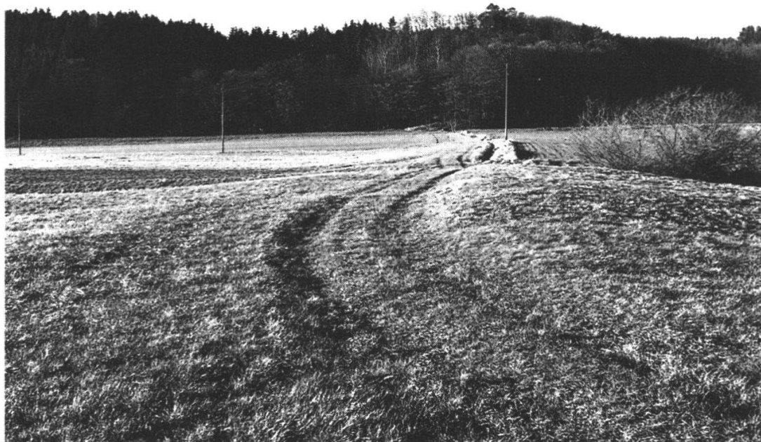
Abb. 14: Der östliche oder grosse Däntsch des Grossweiers heute, nachdem er für die landwirtschaftliche Nutzung stark eingeebnet worden ist (siehe Verlauf des Feldweges). Im Mittelgrund der tief eingesenkte Kanal , im Hintergrund der Kestenholzer Weierrain .

Der Hauptabfluss erfolgte nun während 250 Jahren am südlichen Ende des grossen Däntsches in der südöstlichen Grossweier-Bucht