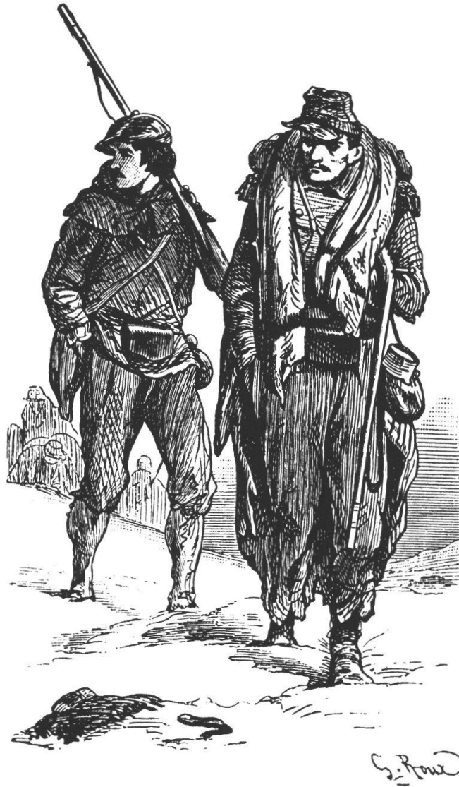
Abb. 24: Liniensoldat und Mobilgardist.

In den Januartagen 1871 (Wirth 1939, 30/31) zählte die Ostarmee ungefähr 140 000–150 000 Menschen, die man Soldaten nannte. Nach der Schlacht bei Héricourt bestand das Ostheer aus 177 Bataillonen Infanterie und einigen Kompanien Franc-tireurs. Die Infanterie war ausserordentlich ungleichmässig zusammengesetzt: aus Linien- und Marschtruppen, Mobilgarden, mobilisierten Nationalgarden, fünf Zuavenregimentern (Berber), einem Regiment afrikanischer Jäger, die nebst den aus Afrika geholten Linienregimentern den Kern der Ostarmee bildeten.