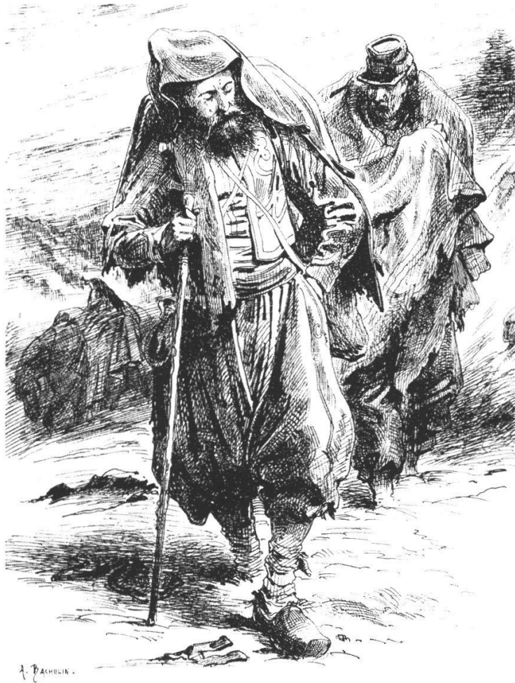
Abb. 26: Zuave und Liniensoldat. Quelle: A. Bachelin «Aux frontières», 1870/1871.