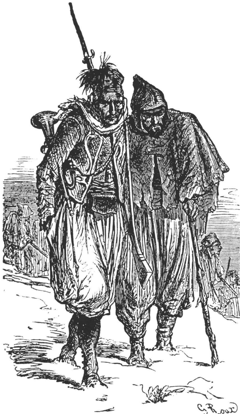
Abb. 25: Turcos. Quelle: A. Bachelin «Aux frontières», 1870/1871.

Nach Wirth (1939, 32) rekrutierten sich die Marschregimenter aus Leuten der Klasse 1869 und einem Grossteil der Altersklasse 1870 und den Reservisten und neu einberufenen Soldaten vom 25.–35. Lebensjahr.