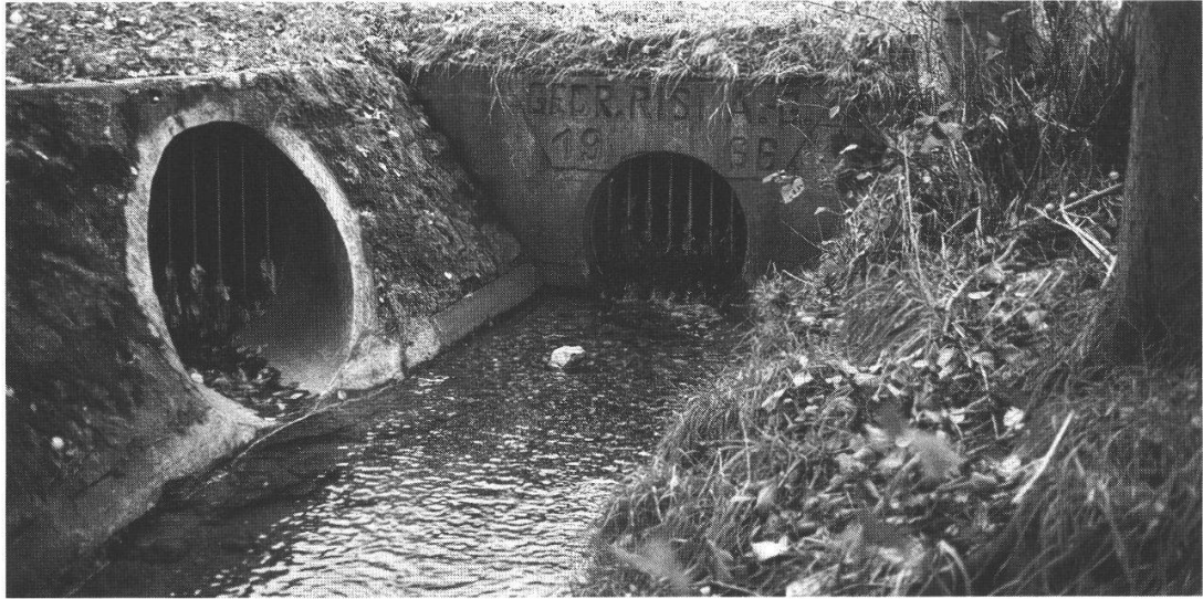
Abb. 4: Der Hardgraben kommt in Neuendorf ans Tageslicht.