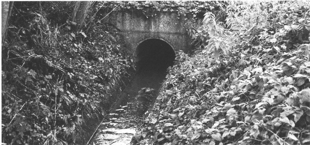
Abb. 5: Der Hardgraben kommt im Hard ans Tageslicht.