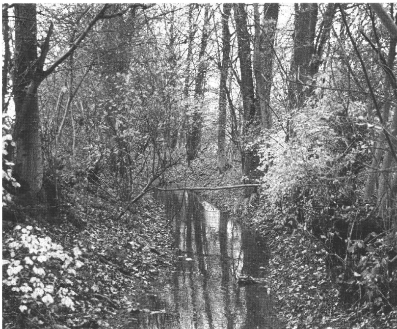
Abb. 1: Hardgraben- Idyll in der «Erlen».

und Äcker zu düngen. 11 Nur so erklärt sich der jahrhundertelange Kampf, der immer wieder um das Wasser geführt wurde.