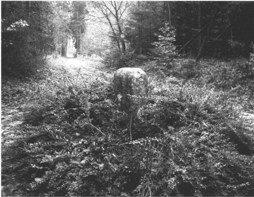
Abb. 2: Der Dreiiangelstein.

hatten. Ist vielleicht das Hard von den Gemeinden Härkingen und Egerkingen in weiser Voraussicht auf die kommende Bevölkerungszunahme urbar gemacht worden?