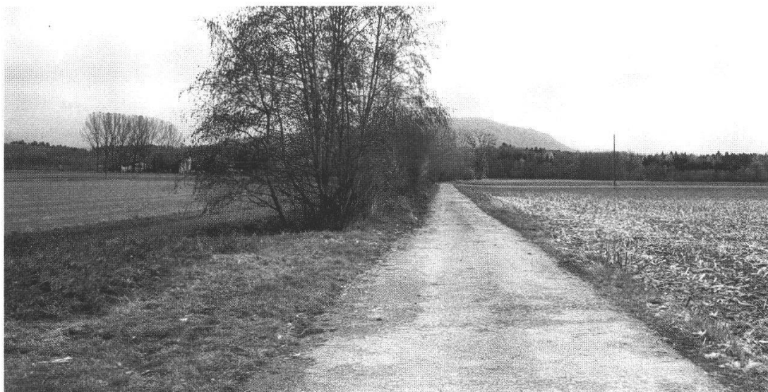
Abb. 6: Der Hardgraben im Hard, von Gebüsch umgeben.