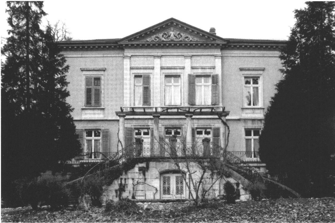
Die Villa «Riant-Mont» am Mühleweg 1 in Solothurn (von Süden) Erbaut 1870–1872. Altersheim von 1930–2003.

Pensionsregelungen kennt man besonders nach französischem Vorbild seit dem Ende des 18. Jahrhunderts vorerst für hohe Beamte, Offiziere und Soldaten, 1 später ausgedehnt auf private Angestellte und ausgewählte Berufsgruppen. In der Schweiz entstehen erste Pensionskassen ab 1860 für Angestellte beim Bund, bei den Kantonen und den Städten, dann bei Berufsverbänden und später durch die Privatwirtschaft. 1907 geniessen die Eisenbahner als Bundesangestellte eine Rentenkasse, 1919 folgt die Versicherungs- oder Pensionskasse des Bundes. 2