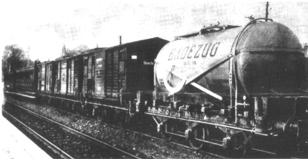
Abb. 19 Der Badezug, in: Schweizer Illustrierte Zeitung Nr. 17 (1914), 259. «Der Stellungskrieg zwingt den modernen Soldaten zu einem wahren Troglodytendasein. Damit ist aber nicht gesagt, dass der Mensch des 20. Jahrhunderts nun mit einem Male auch in seinen Ansprüchen wieder auf die Stufe des Höhlenbewohners der vorgeschichtlichen Zeit zurückgesunken sei. [...] Das Wasser wird durch den Dampf der Lokomotive erhitzt und mittelst Dampf in die Badewagen gedrückt, von denen der eine 10 Brausen und ein Wannensbad für Offiziere enthält, während die beiden anderen 16 Brausen aufweisen».

Die Abbildung eines deutschen Badezuges in der Schweizer Illustrierten Zeitung von 1914 mag die Hoffnung auf den Erhalt der Zivilisation ebenfalls hoch gehalten haben.