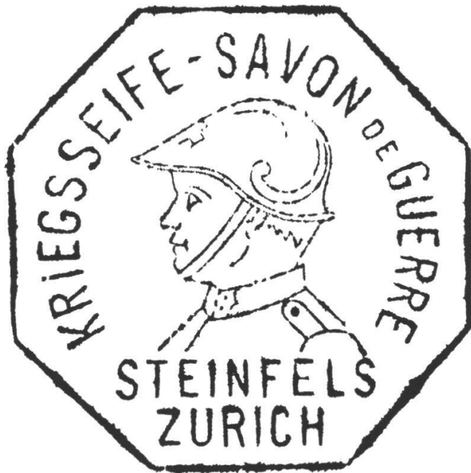
Abb. 18 Stempel Kriegs- seife, in: Bondt, Fünf Generationen Steinfels, 73.

should war soap gain more and more importance (as it may do), it is even better for us to put our name on it, as, otherwise, we would practically disappear in the eyes of the public as suppliers of soap». 143