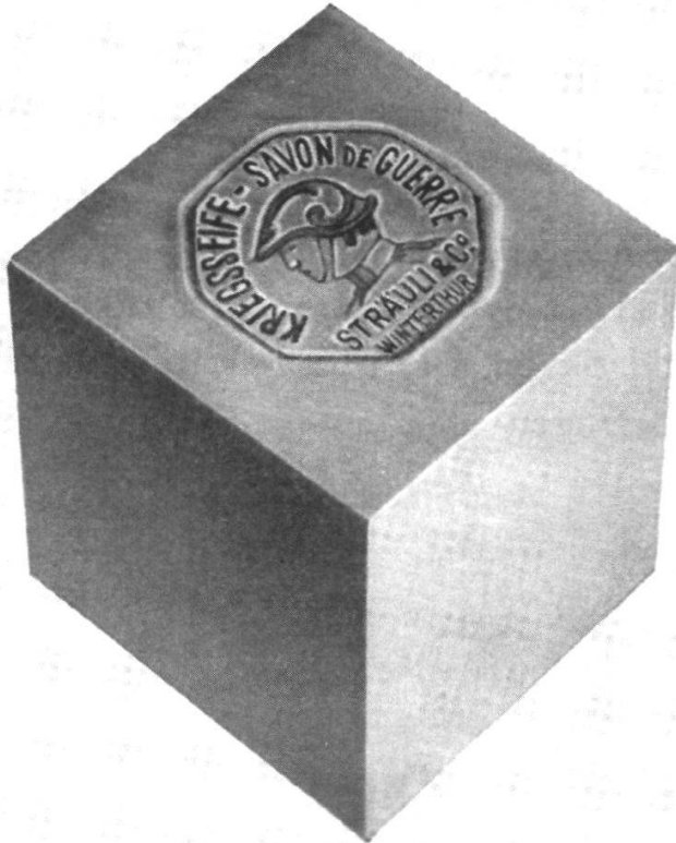
Abb. 17 Kriegsseife, in: Sträuli & Co. 1831–1931, 99.

Jeder Seifenhersteller verpflichtete sich, 30% seiner harten Öle und Fette – Coprah, Palmkernöl, Palmöl, Talg, Stearin und Baumwollkernöl – für die Produktion der Kriegsseife zu reservieren. Die Rezeptur blieb dem Hersteller freigestellt, doch wurde der Fettgehalt auf 30 bis 35% und ein einheitliches Gewicht von 350 Gramm festgelegt. 136 Als Dekor setzte sich « the bust picture of a Swiss soldier in Swiss war helmet » durch. 137