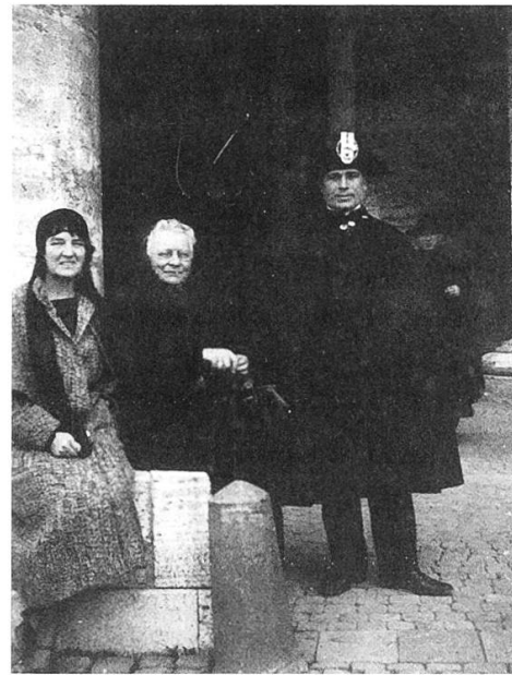
Abbildung 3: Nach einer Papstaudienz in Rom, März 1931.