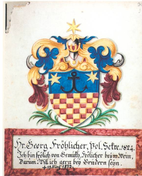
Wappen von Georg Frölicher.

Zwischen 1806 und 1870 trat der bürgerliche Charakter in der Confraternitas Sancti Valentini noch deutlicher zutage als im 17./18. Jahrhundert. Von den 166 in diesem Zeitraum Aufgenommenen waren 105 (63,2 %) dem Bürgertum, zwei (1,2 %) dem Klerus und 59 (35,5 %) dem Patriziat zuzurechnen.