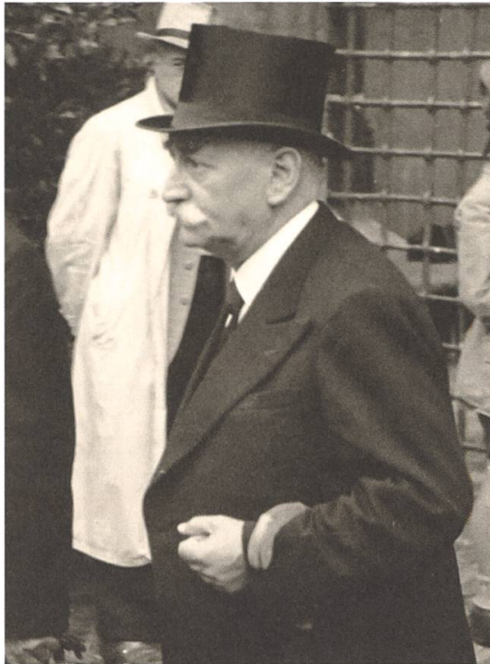
Regierungs und Nationrat Jacques Schmid.