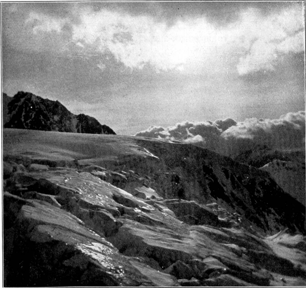
Glacier de Ried vers Nadelgrat (Soir)