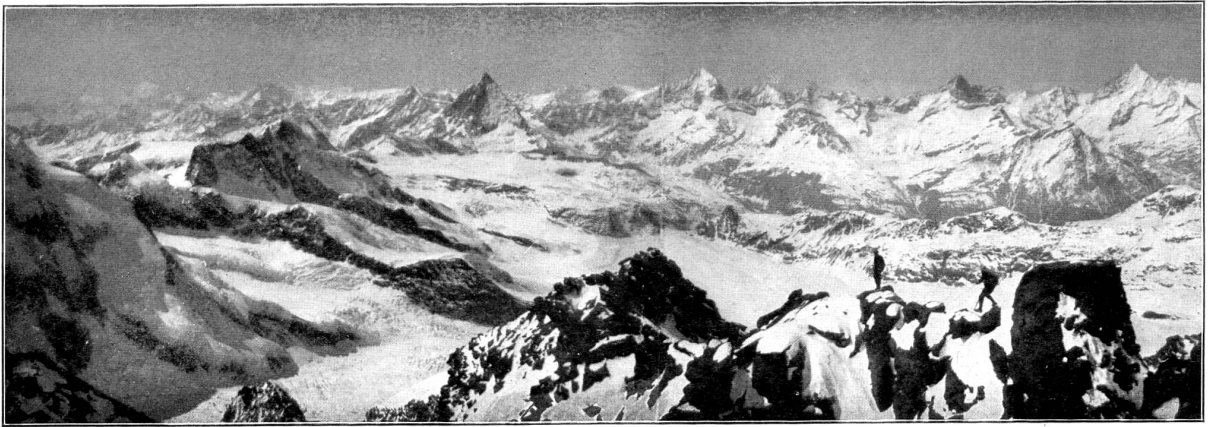
Sur l'arête du Mont Rose, à 4600 mètres