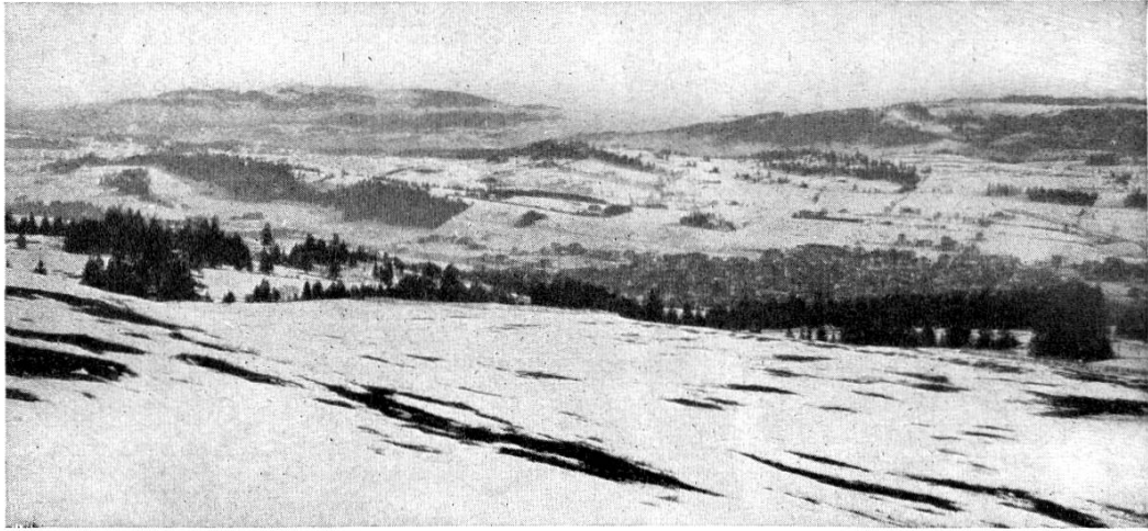
Chaux-de-Fonds mit Chasseral