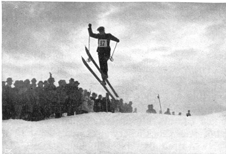
Geländesprung im Slalom

Die neue Pouillerelschanze war vom S. C. Chaux-de-Fonds mit grossen Kosten eigens für den Verbandswettlauf erbaut und von zwei bewährten Springern — Björnstad und Walty, wenn ich nicht irre — erprobt und für gut befunden worden. Sie hat im Gegensatz zu allen bisherigen schweiz. Sprunganlagen die Eigentümlichkeit, dass ihr Auslauf, weil fast kein Platz dazu vorhanden war, sehr kurz ist. Man hat ihn daher stark erhöht, ähnlich wie bei der Semmeringschanze. Eine grosse Tanne stand mitten im Auslauf, einige Meter von der Umzäunung und der Tribüne entfernt. Bei der Ausprobung störte sie nicht stark; am Springen selbst aber zeigte es sich, dass sie ein ernstliches Hindernis bildete. Ein Junior prallte gleich zu Anfang direkt gegen sie an; daher musste sie dran glauben. Es scheint, dass der Schnee durch den Regen sehr glatt geworden und das Di-