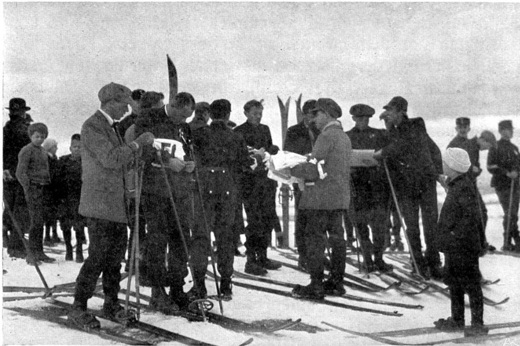
Verteilung der Nummern

einteilung war darum schwierig genug, wie dem Kundigen ein Blick auf die Notenliste sofort aufdeckt (bei Nr. 12 scheint übrigens ein Irrtum in der Zeitnahme vorgekommen zu sein). Das Kampfgericht hat trotzdem nach bestem Wissen und Gewissen geurteilt und dürfte im allgemeinen auch das Richtige getroffen haben. Allein ideal ist dieser Wettlauf und seine Bewertung immer noch nicht und daher die Abneigung gewisser Richter gegen seine Abhaltung bei Verbandswettläufen überhaupt begreiflich. Dem Zuschauer