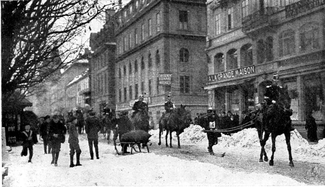
Abmarsch der Patrouillen