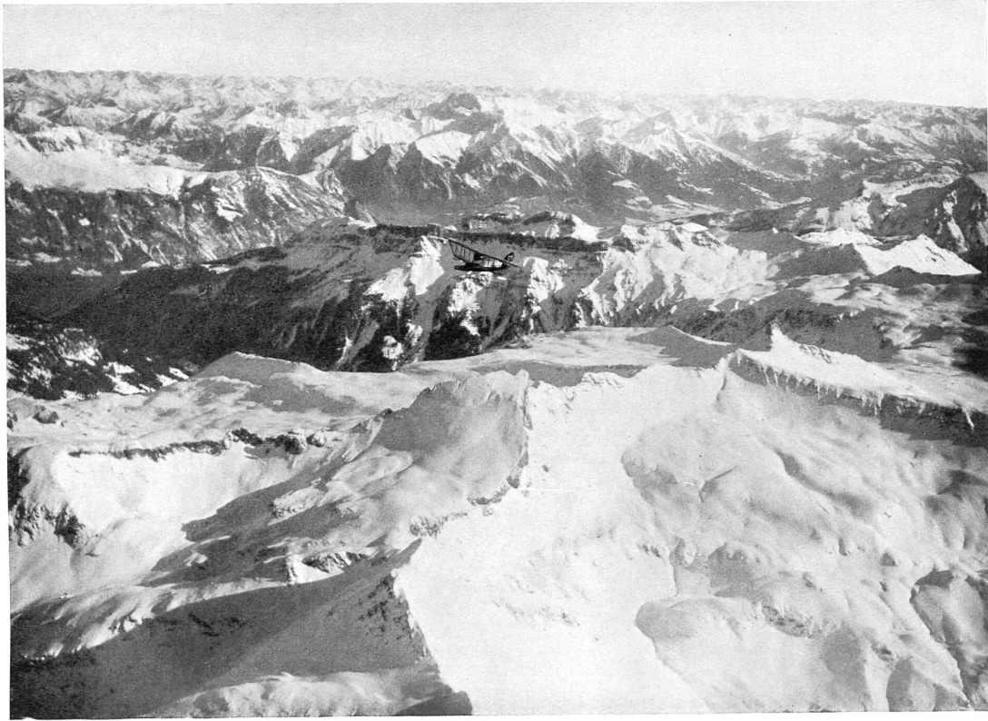
Fliegeraufnahme der Ad Astra, Zürich Weissmeilen, Spitzmeilen; Schils- Seez- und Rheintal. Im Hintergrund Scesaplana; von W. 4000 m.