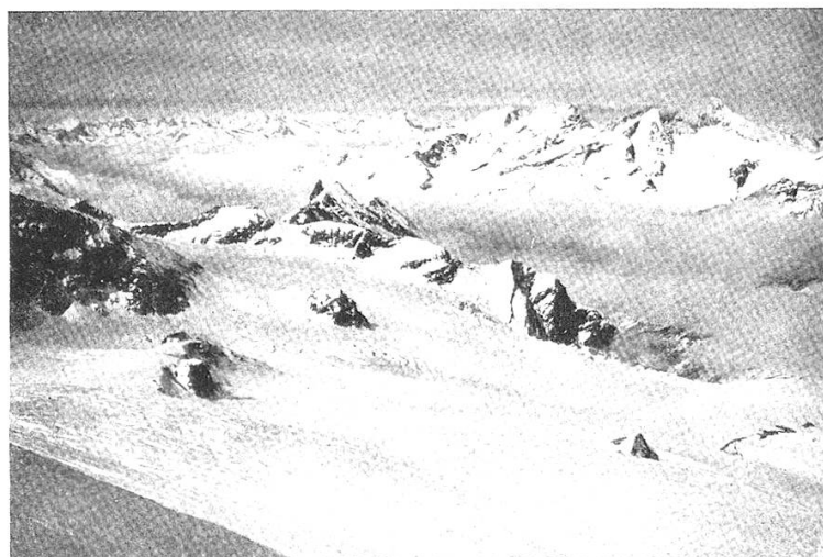
Blick von Fluchthorn gegen Britannia; J. Gaberell Egginer- und Weissmiesgruppe