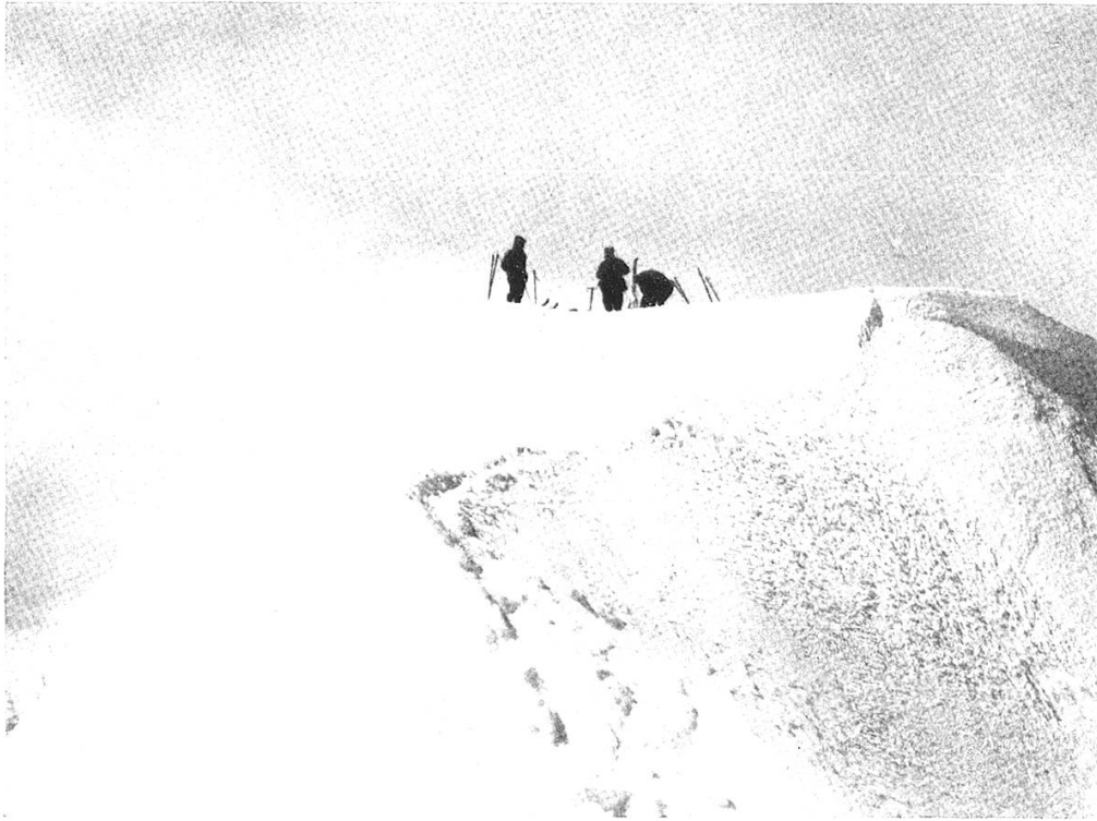
Tödi Rusein 3623 m