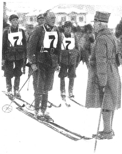
Die siegreichen Norweger