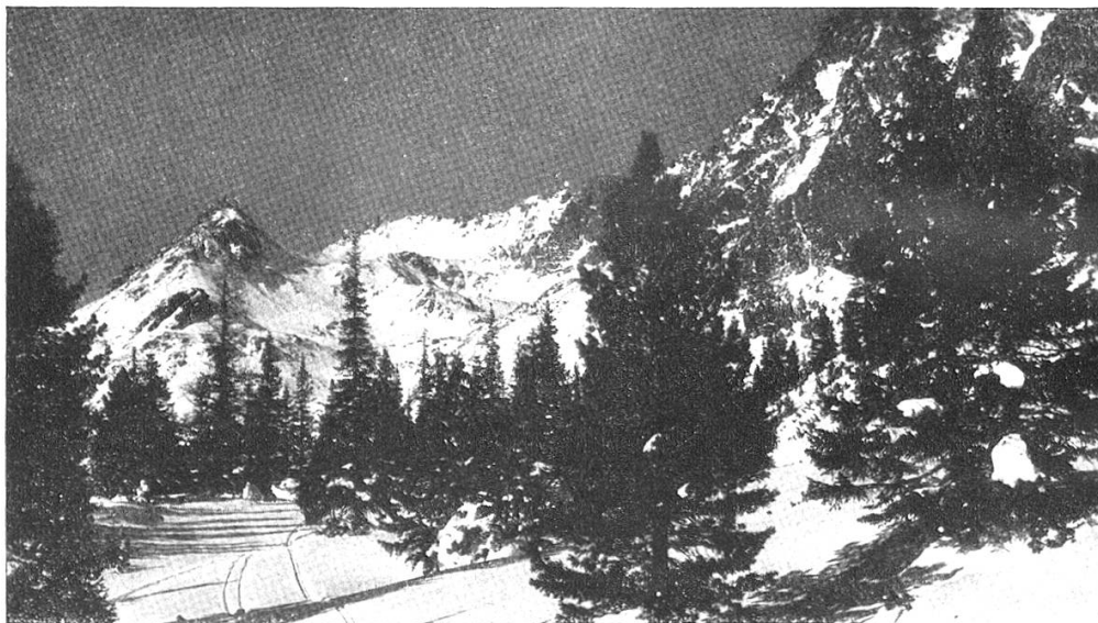
Winter in der Hohen Tatra