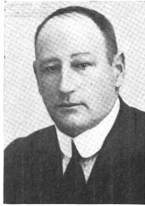
R. v. Craffenried, Bern 1916—1920