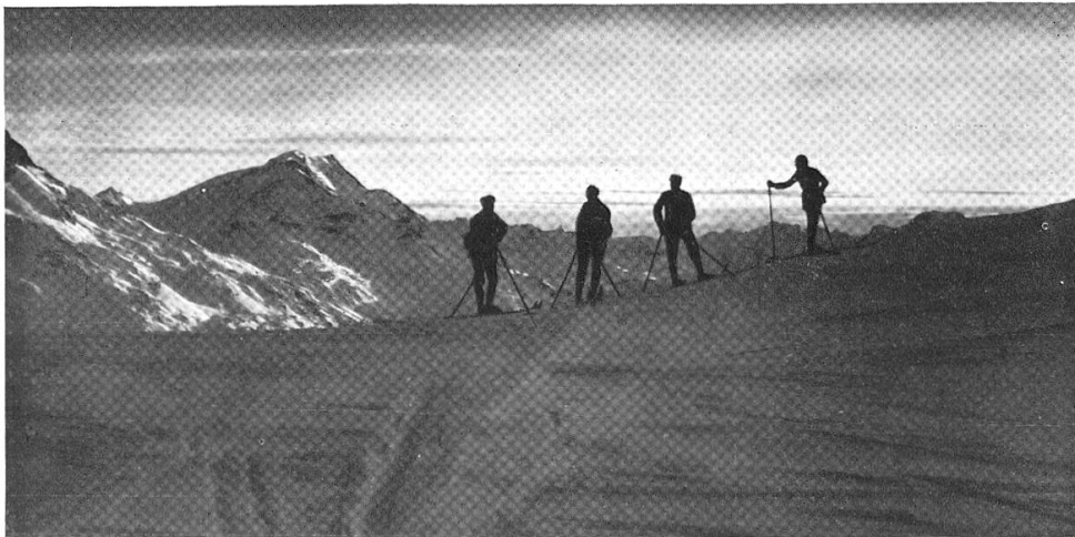
Ausblick (Piz Corvatsch)