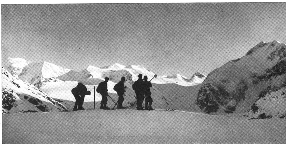
Palü, Bellavista, Bernina