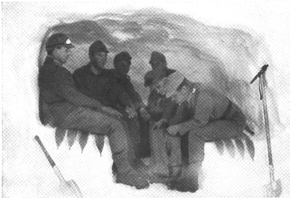
Unterstand in einer Schneewehe, windgepresster Schnee. Arbeitsdauer 25—30 Min. Fassung: 8 Mann; mit 3 Iselin-Schaufeln.