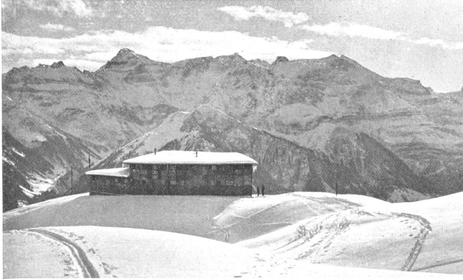
Ortstock-Skihaus mit Hausstockgruppe