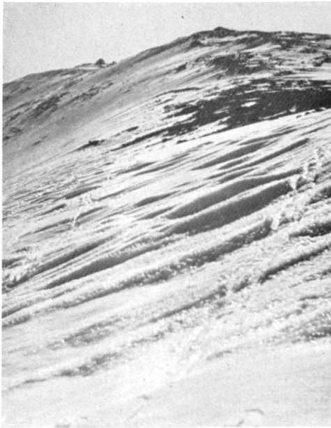
Sommet du Mt. Washington, 6290 feet