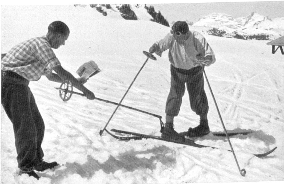
Die verflixten Skibuchschreiber! Und da soll einer klar werden!

Il faut espérer que les pistes seront de plus en plus aménagées pour permettre le ski. Car un virage à angle droit sur une piste large de moins d'un mètre quand on a aux pieds des skis de 2,10 m. est une opération qui ne laisse pas d'être compliquée et dont la solution n'est donnée par aucun des écrits de Lunn, de Schneider ou de telle autre lumière du ski. Le ski s'est maintenant implanté en Amérique du Nord orientale et il a définitivement gagné la partie contre la raquette. Il ne s'agit donc plus que d'une question de temps pour que, sur des pistes élargies, le tourisme à ski devienne réalité. Celui qui n'a pas encore goûté au «ski sur piste», ce sera là ma conclusion, a encore beaucoup de bonheur devant lui.