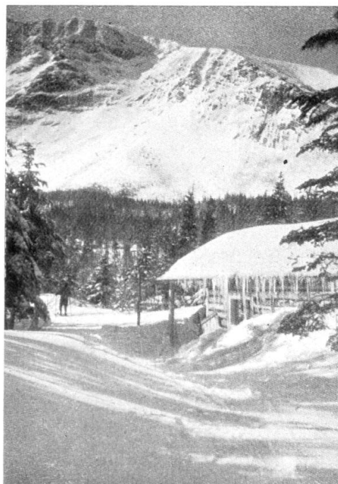
Le Mt. Katahdin (Maine), vue de Chimney Pond