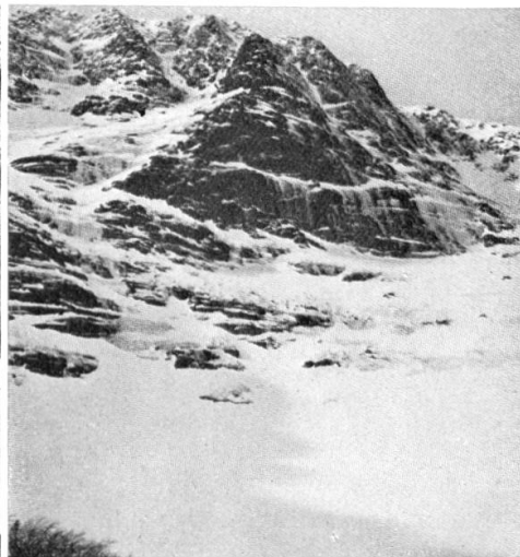
Le Sodkar (South Basin) du Mt. Katahdin

aux portes de la ville. Mais le vrai skieur préfère la région où sont blottis les hameaux de Mont Rolland, Sainte Marguerite, Ste. Agathe et St. Jovite. La neige y est généralement assez épaisse pour couvrir les sous-bois et rendre fort plaisant le ski en forêt. Les collines y sont basses et ondulées. Comme on peut s'y attendre pour une pénéplaine érodée, il n'y a ni sommets saillants ni longues excursions comme de l'autre côté de la frontière, mais il y a de quoi permettre de l'excursions les plus variées et les plus plaisantes. Une région très pareille se retrouve dans le bouclier Laurentien au nord du Labrador mais on n'y peut aller que là où le chemin de fer s'est introduit. A Québec on peut faire du ski sur les collines au nord de la ville et un voyage jusqu'à Point à Pic (Baie de Murray), point terminus de la ligne, vaut à qui s'y rend plus d'une belle course. Nulle part cependant les montagnes ne dépassent 700 m. et les forêts sont terriblement denses. On pourrait prolonger indéfiniment la liste des possibilités mais elles ne sont jamais plus «satisfaisantes», car sauf pour quelques très rares centres, les skis ne sont qu'un moyen de se transporter qui remplace les raquettes où les attelages de chiens. Et puis on ne peut pas songer au développement d'un sport dans un pays où il faut transporter avec soi sa couche et sa nourriture, et où il s'agit d'arriver à l'étape avant que les provisions ne soient épuisées.