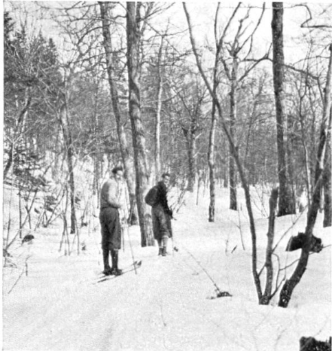
Dans les bois de Wilmington (Vermont)