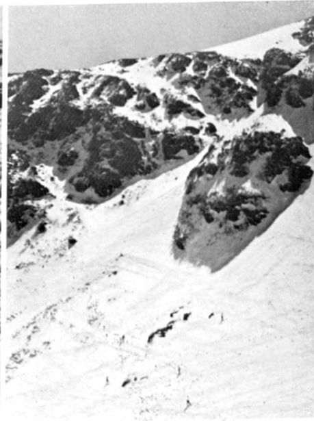
Tuckermans Ravine du Mt. Washington