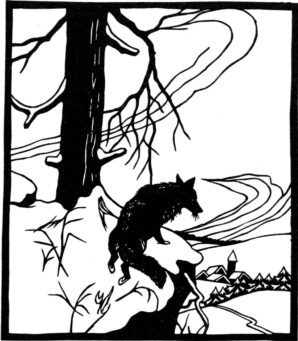
Die harte Zeit