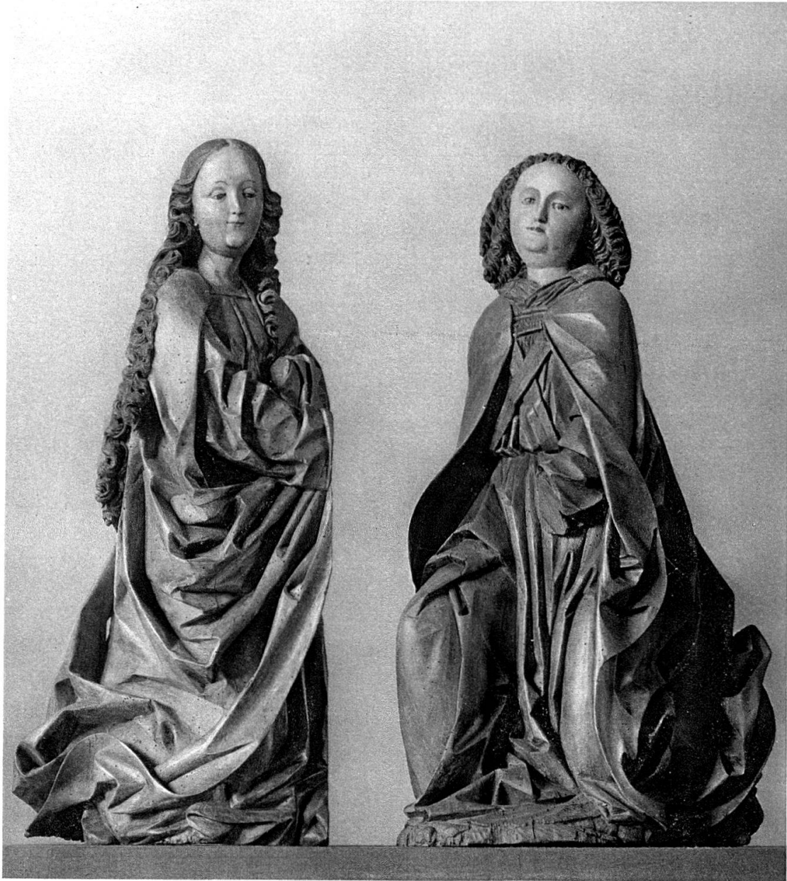
Fragment einer Verkündigungsgruppe. Bemalte Holzstatuen aus der Kirche von Sulz bei Laufenburg. Um 1500.