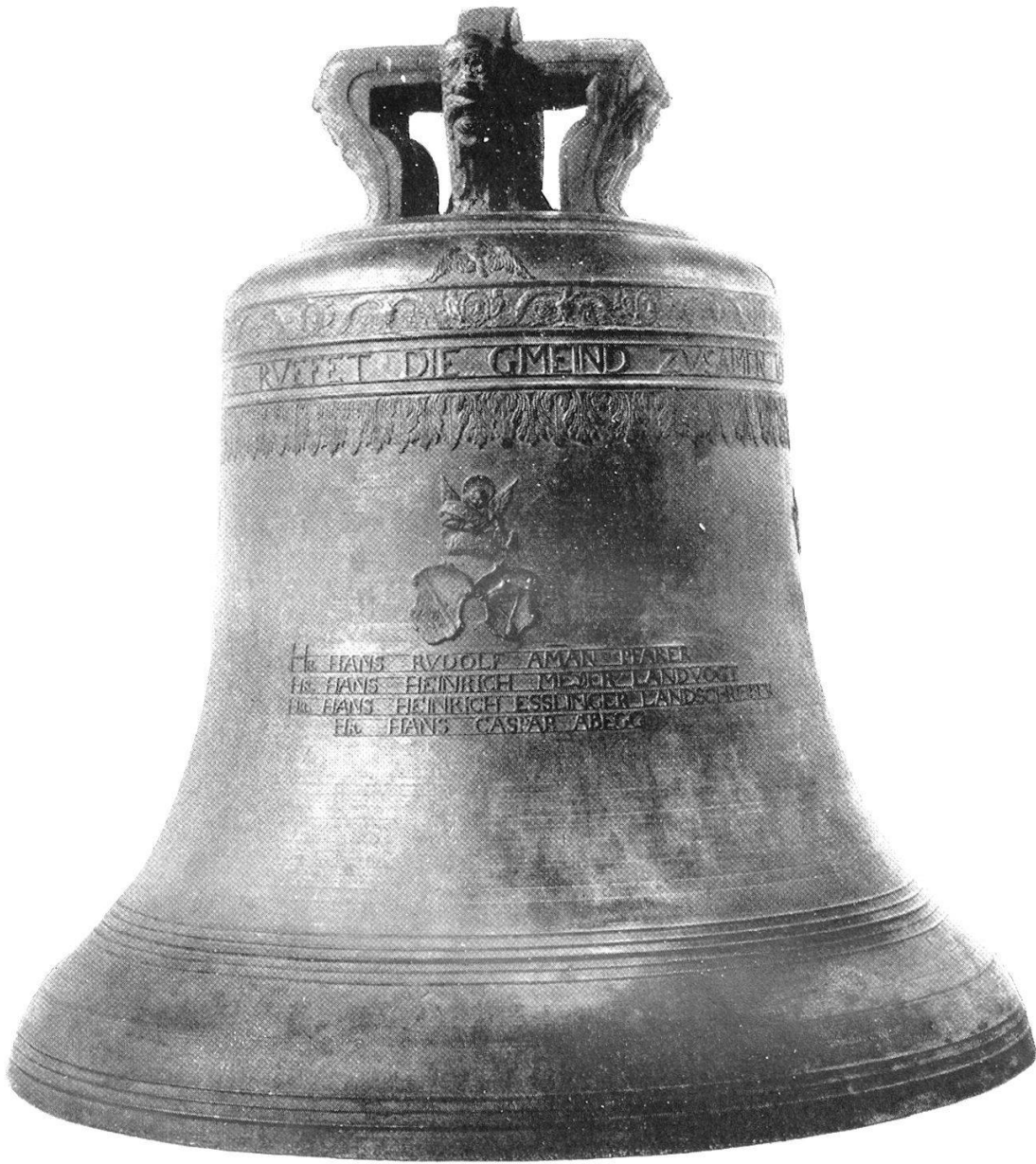
Abb. 22. Grosse Glocke aus der Kirche von Knonau. Gegossen von Heinrich I. Füssli in Zürich 1666.