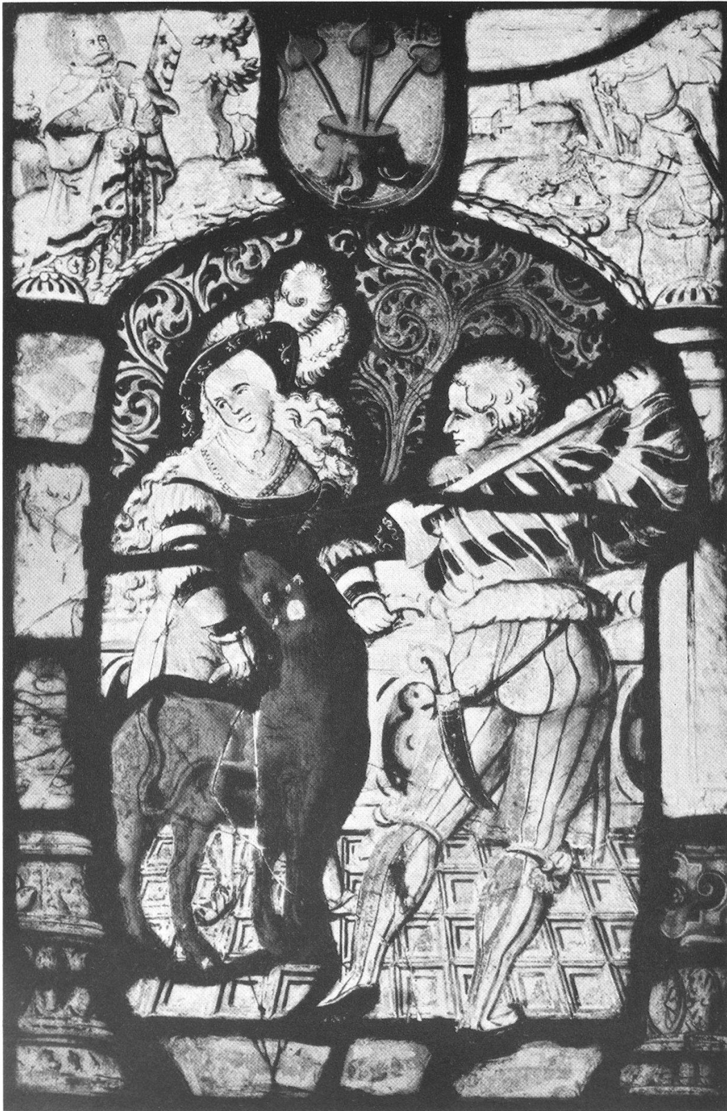
Figurenscheibe des Peter Wickardt von Zug, 1545.