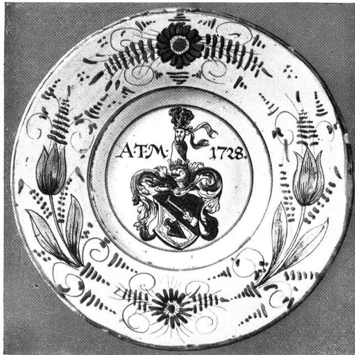
Buntbemalte Fayenceplatten mit Wappen Obrist und Thomann, 1728. Vermutlich Arbeiten der Bleulerschen Hafnerei in Zollikon bei Zürich.