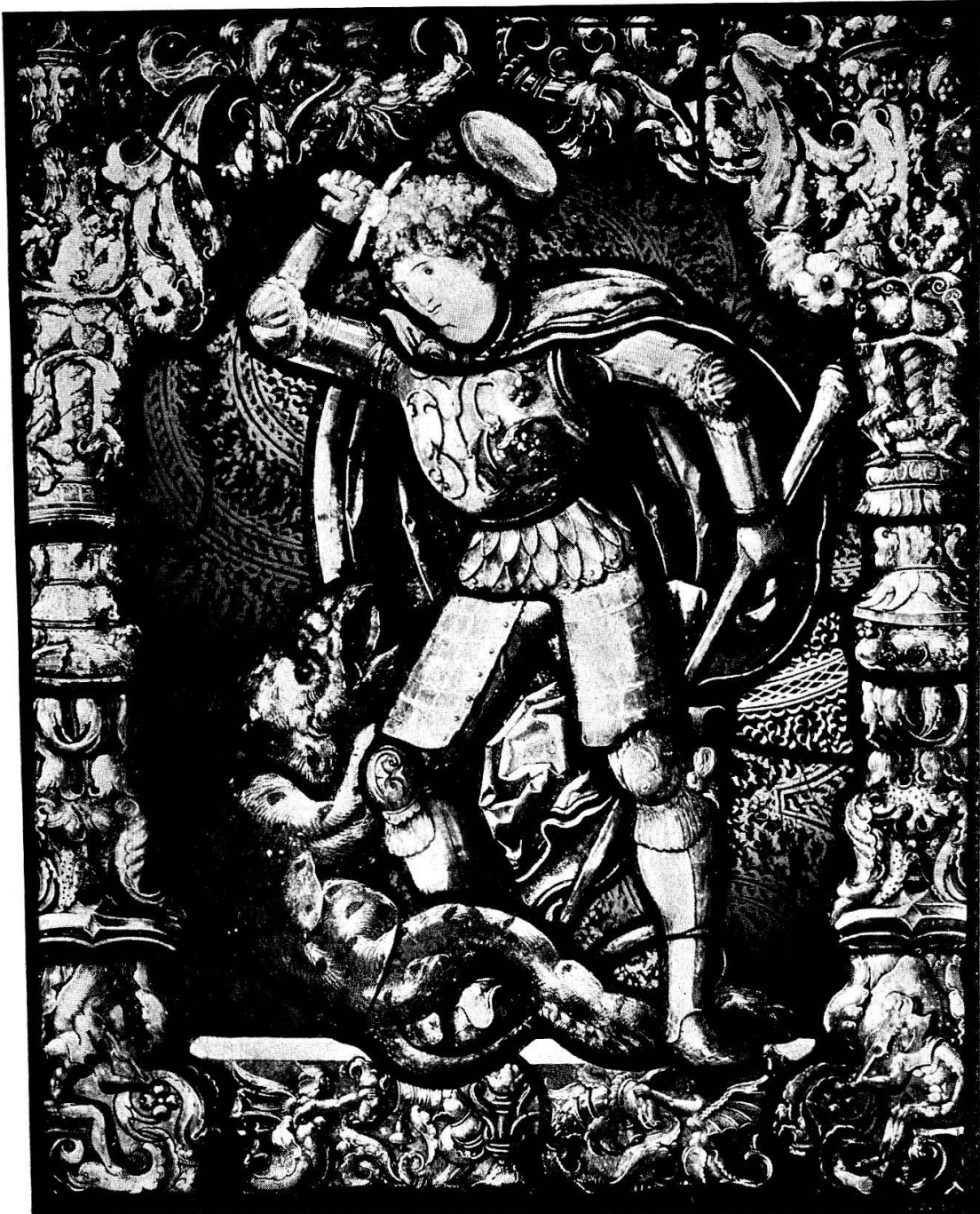
St. Georg im Kampf mit dem Drachen Vermutlich Arbeit des Glasmalers Lukas Schwarz in Bern, um 1520