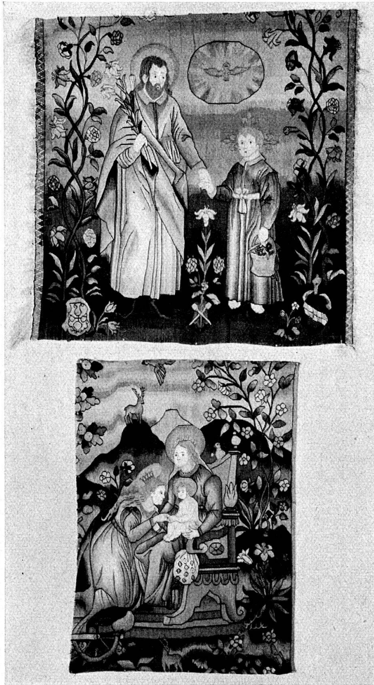
Zwei Teilstücke von Antependien in bunter Wollenwirkerei, aus dem Kloster Eschenbach (Luzern), mit Wappen des Cisterzienserordens und der Aebtissin Ludwina Dulliker, 1647—1674