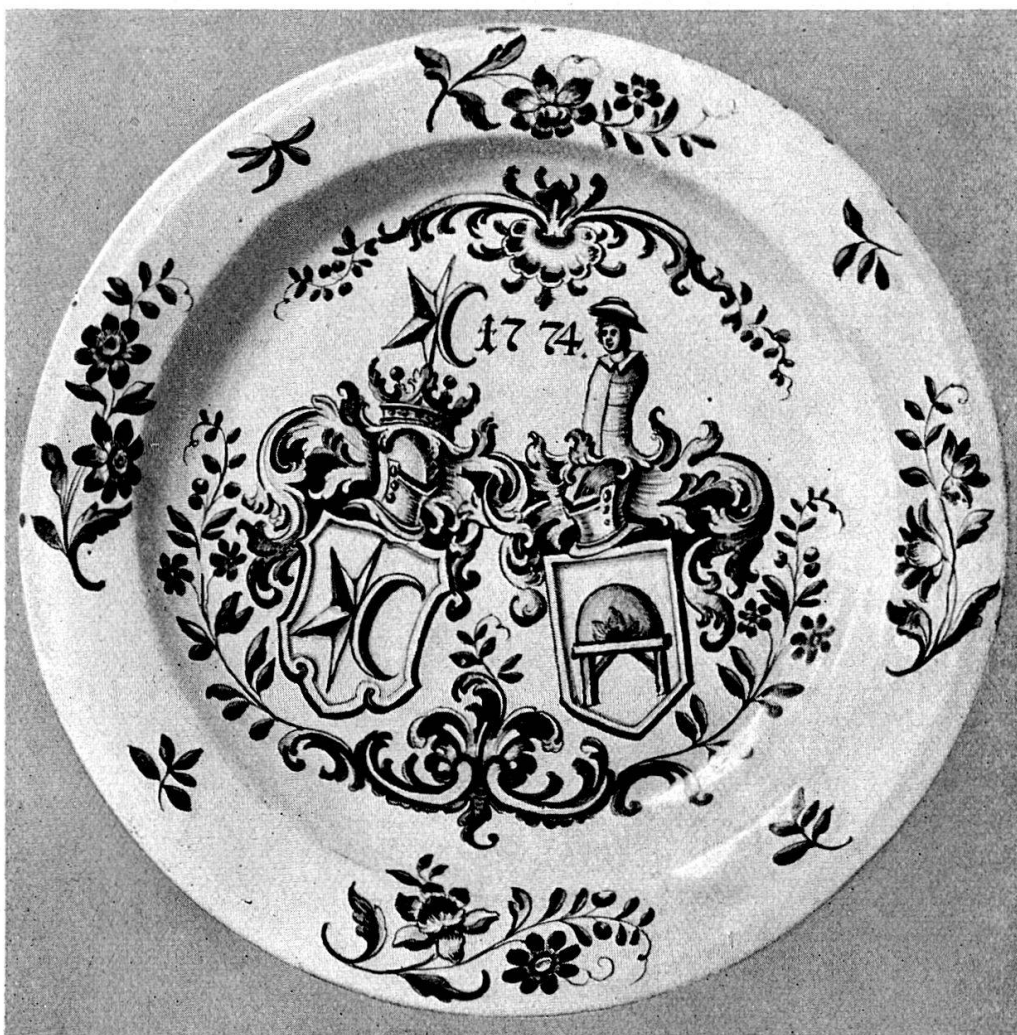
Blaubemalte Fayenceplatte mit Wappen Sprüngli-Bachofen, Zürich. 1774