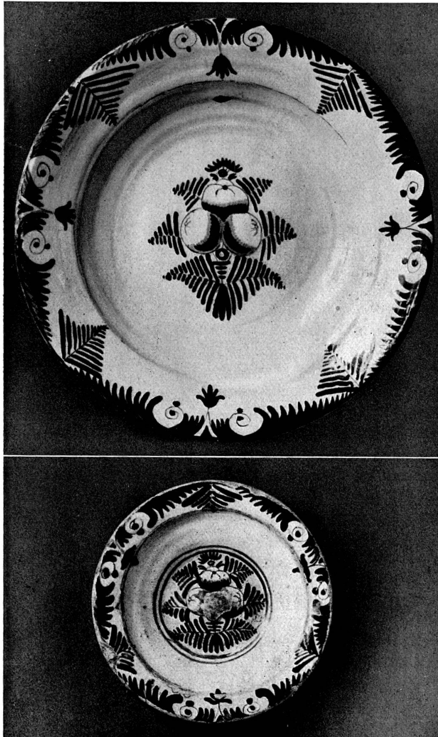
Abb. 1 Blaubemalte Fayencen Fabrikate der Bleuler'schen Hafnerei in Zollikon, 18. Jh. Mitte