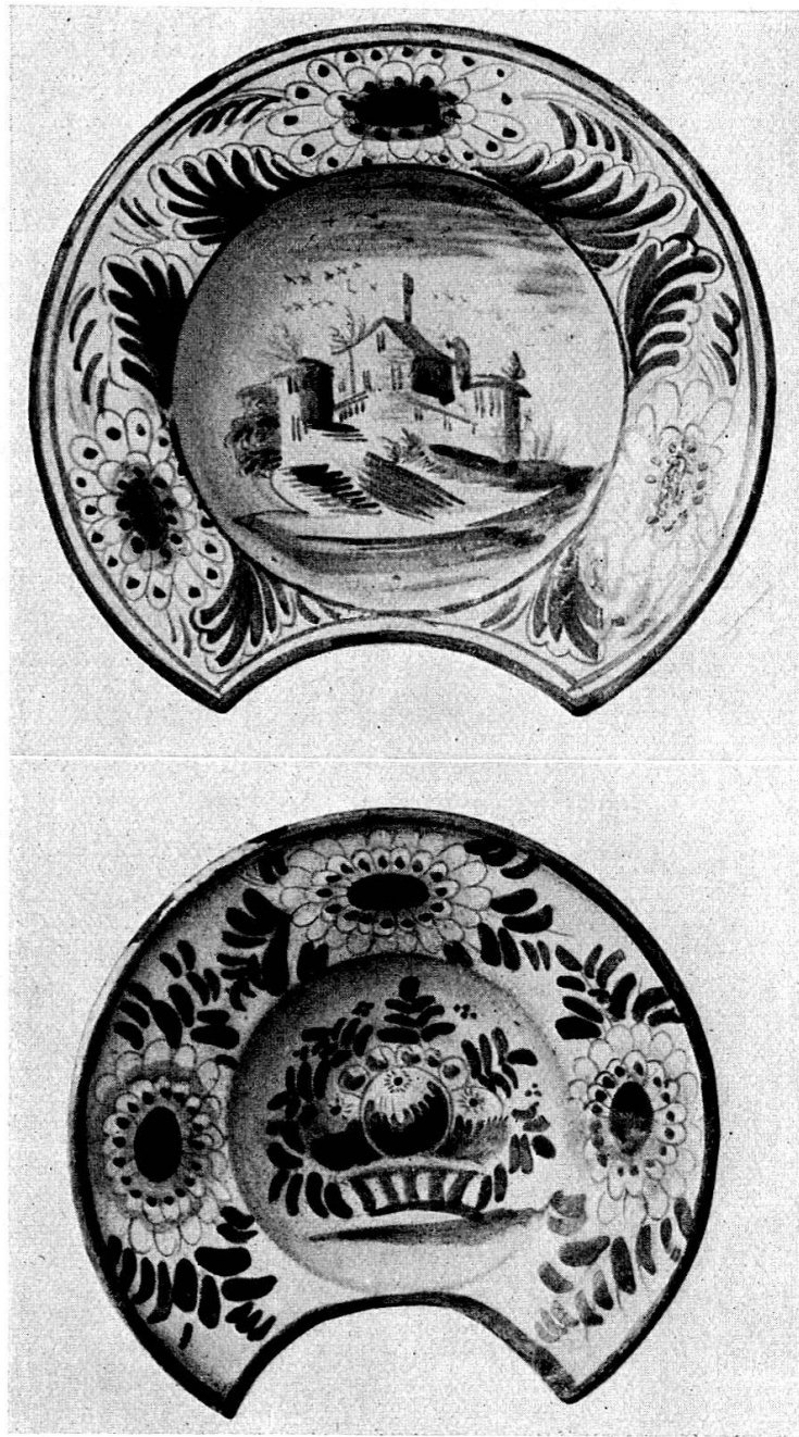
Abb. 5 Blaubemalte Rasierplatten, Ostschweiz 18. Jh. 1. H.