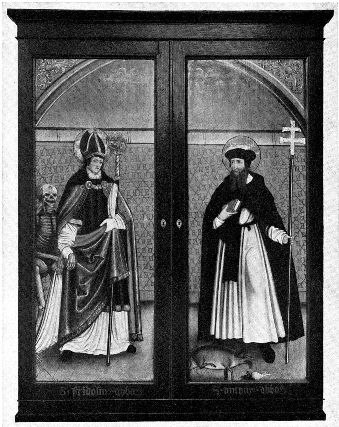
Altar aus Bremgarten, geschlossen, 16. Jh. Anfang