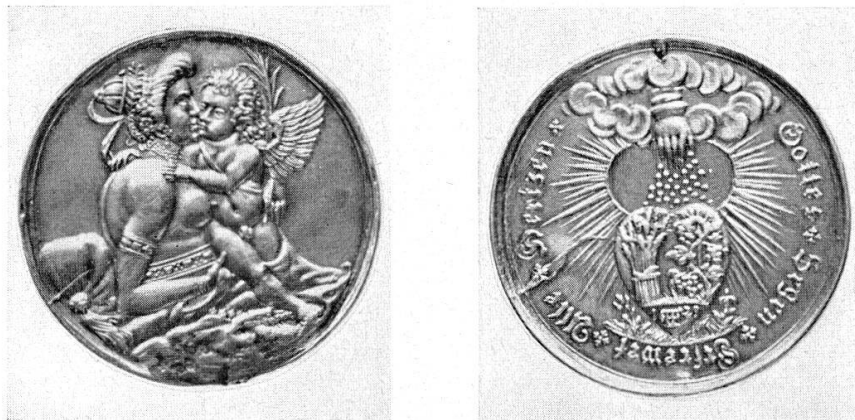
Abb. 23 Ehepfennig von Friedrich Fecher, 1629. (S. 29)

Sollte einmal doch der ersehnte Zustand eintreten, daß die Schätze des Münzkabinetts in einem eigenen, genügend großen Raum den Besuchern des Landesmuseums vorgeführt werden können, so wird der Münzfund von Überstorf als geld- und münzgeschichtlich, aber auch als allgemeines geschichtlich interessantes Monument dort einen wichtigen Platz einnehmen: als — ich möchte sagen — lebendiges Anschauungsmaterial, das mithelfen wird, in allen Kreisen der Bevölkerung die Bedeutung von Münzfunden für die geschichtliche Erkenntnis ins Bewußtsein zu rufen.