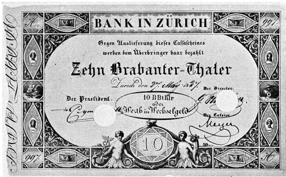
Abb. 24 Banknote der Bank in Zürich, 1837.

In der Schweiz erscheint die Banknote recht spät. Das erste große europäische Banknotenexperiment, das an der ungenügenden Deckung scheiterte, der berühmte Schwindel des John Law in Paris zur Zeit der Regentschaft 5 und später ganz besonders die üblen Erfahrungen, die man in der Schweiz mit der Assignatenwirtschaft der französischen Republik gemacht hatte, schufen in