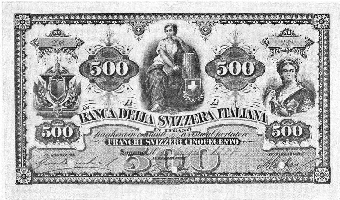
Abb. 27 Banknote der Banca della Svizzera Italiana, 1877.

Zusammenhänge mit der großen Kunst aufdecken. Die wirtschaftliche und geistige Abhängigkeit der Schweiz vom Ausland gibt sich bei den Noten deutlich kund: Entweder wurden sie außerhalb unseres Landes hergestellt, in Frankreich, Deutschland, Italien und Amerika, oder die in der Schweiz gedruckten Serien waren Ableger des französischen, englischen, deutschen und des amerikanischen Banknotentyps. 9 Wirtschaftliche und geistige Beziehungen finden darin wiederum ihren Ausdruck. Es sind dies einige