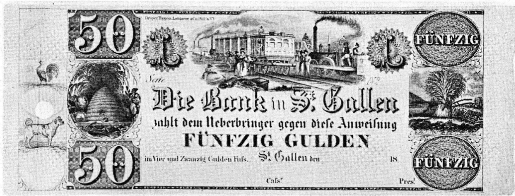
Abb. 26 Banknote der Bank in St. Gallen, um 1850.

Beim Übergang der Sammlung an das Landesmuseum stellte sich die Frage nach einer möglichst günstigen Aufbewahrungsweise; denn die bisherige — die Noten waren in drei großen Folianten eingeklebt — war auf die Dauer ungeeignet. Es war nun unsere erste Aufgabe, die einzelnen Stücke von ihrer Unterlage zu befreien, so daß man sie von beiden Seiten betrachten