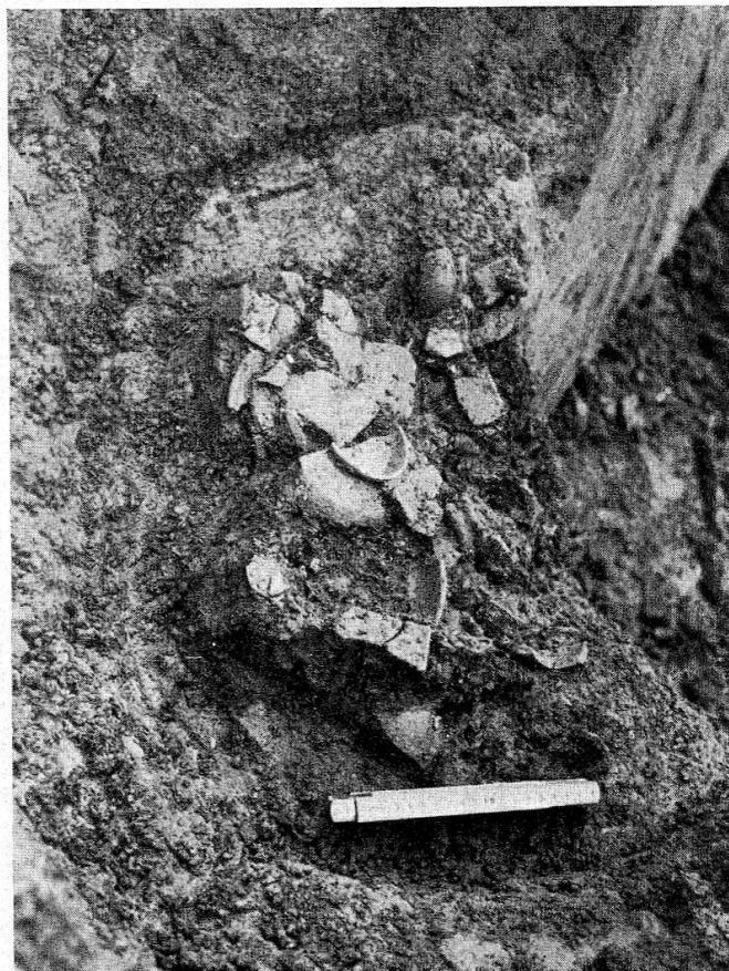
Abb. 3. Zwei römische Brandgräber von Neftenbach, Kt. Zürich. (S. 11)