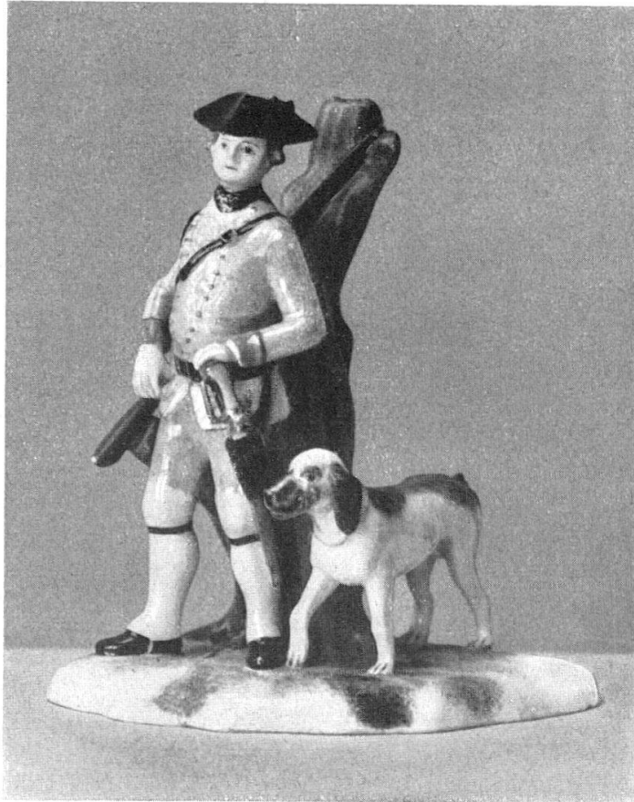
Abb. 21. Jäger, Zürcher Porzellanfigur, um 1770. (S. 21)

Neuenburg, Stadtbefestigung und Schloss: 5 Originalzeichnungen, Situation zur Entwicklung der westlichen Befestigungsanlagen, Grundriss 1:50 vom Schlossturm, Grundriss und Ansicht 1:20 des halbrunden