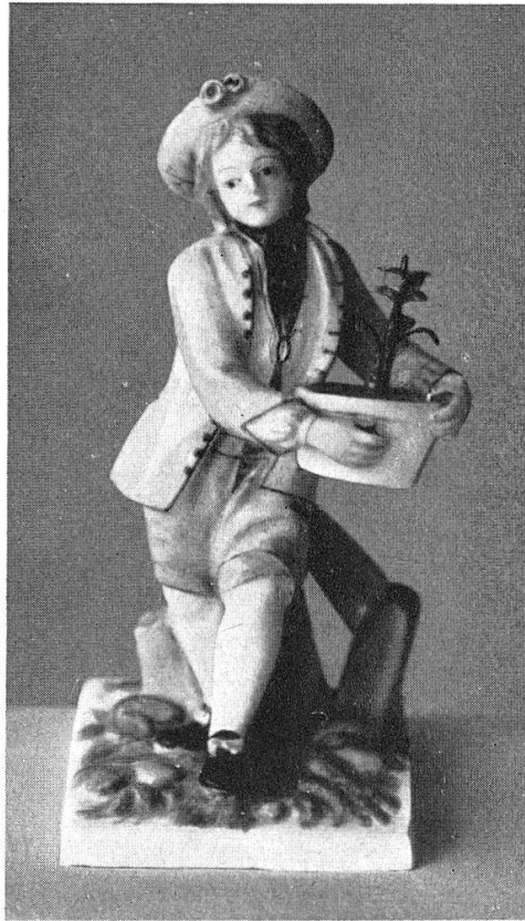
Abb. 22. Knabe mit Blumenstock, Zürcher Porzellanfigur, um 1770/80. (S. 21)

Schaffhausen, Haus zum Buchsbaum: 4 Photographien der Wandbilder des 15. Jh., entdeckt 1947, abgelöst im Winter 1947/48.