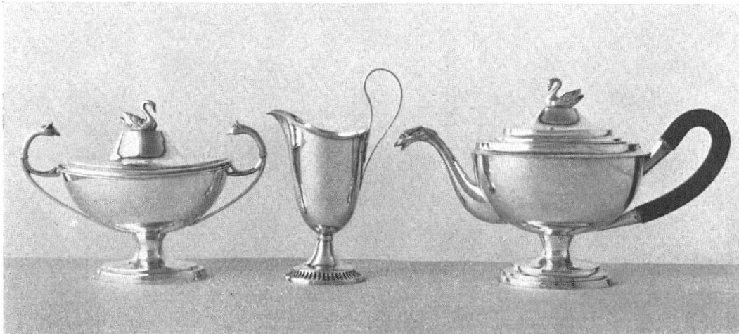
Abb. 24. Teeservice (Auswahl), Silber, Zürcher Arbeit, 19. Jahrh., 1. Viertel. (S. 24)

Uerikon, gotische Kapelle, Restaurierung 1946: 3 kolor. Plandrucke, Steinhauerarbeiten 1 : 10; 9 Lichtpausen, Grundrisse, Fassaden, Decke, Bestuhlung und Bodenbelag, sowie Details 1 : 50/10; 20 Photographien, Aussen- und Innenansichten vor, während und nach der Restaurierung, sowie Restaurierungsinnschrift; 1 illustrierter Jahresbericht 1946 der «Ritterhaus-Vereinigung Uerikon-Stäfa».