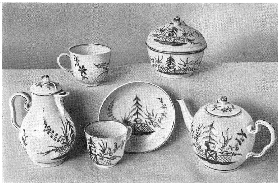
Abb. 19. Teeservice, Zürcherporzellan mit korallenrotem Dekor, 18. Jahrh., 3. Drittel. (S. 21)

Masans, reformierte Kirche: 1 Originalplan, Kämpferdetail vom Chorbogen 1:1.