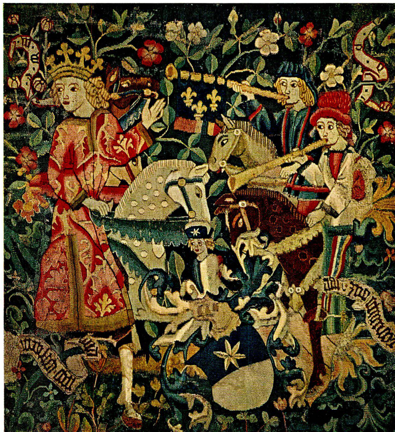
Abb. 1. Bildwirkerei mit Wappen Bubenberg, um 1470 (S. 9)