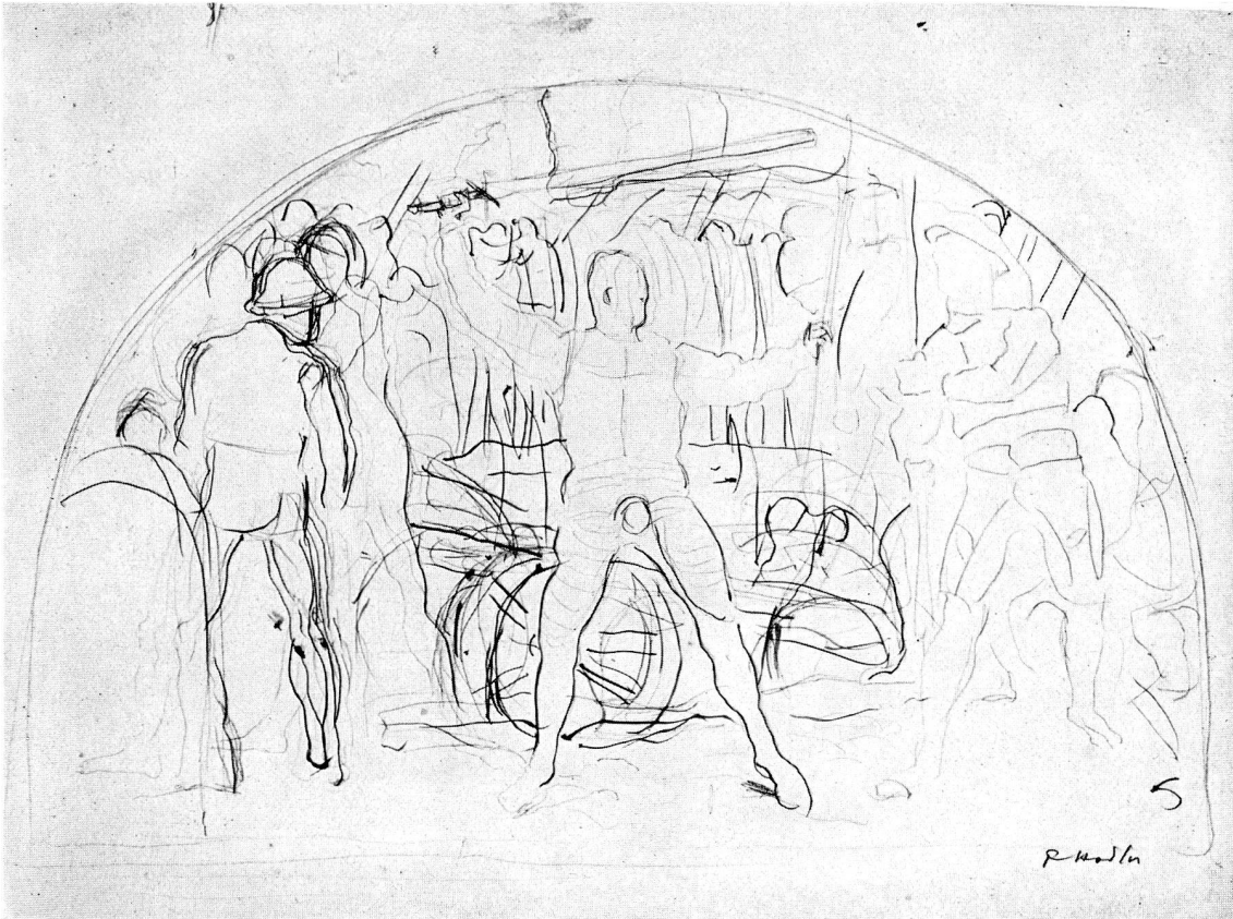
Abb. 23. F. Hodler, Entwurf zum «Rückzug von Marignano» im Landesmuseum, um 1896 (S. 12)