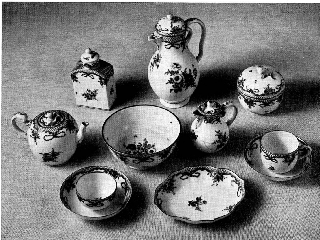
Abb. 21. Tee- und Kaffeeservice aus Zürcher Porzellan, um 1775/80 (S. 11)

Tee- und Milchkanne, Zucker- und Teedose, Wasser- und Konfektschale, sechs niederen Tassen und drei hohen Henkel-tassen mit Untertassen. Aus dem Handel, Basel, um 1775–1780. Abb. 21 und S. 11