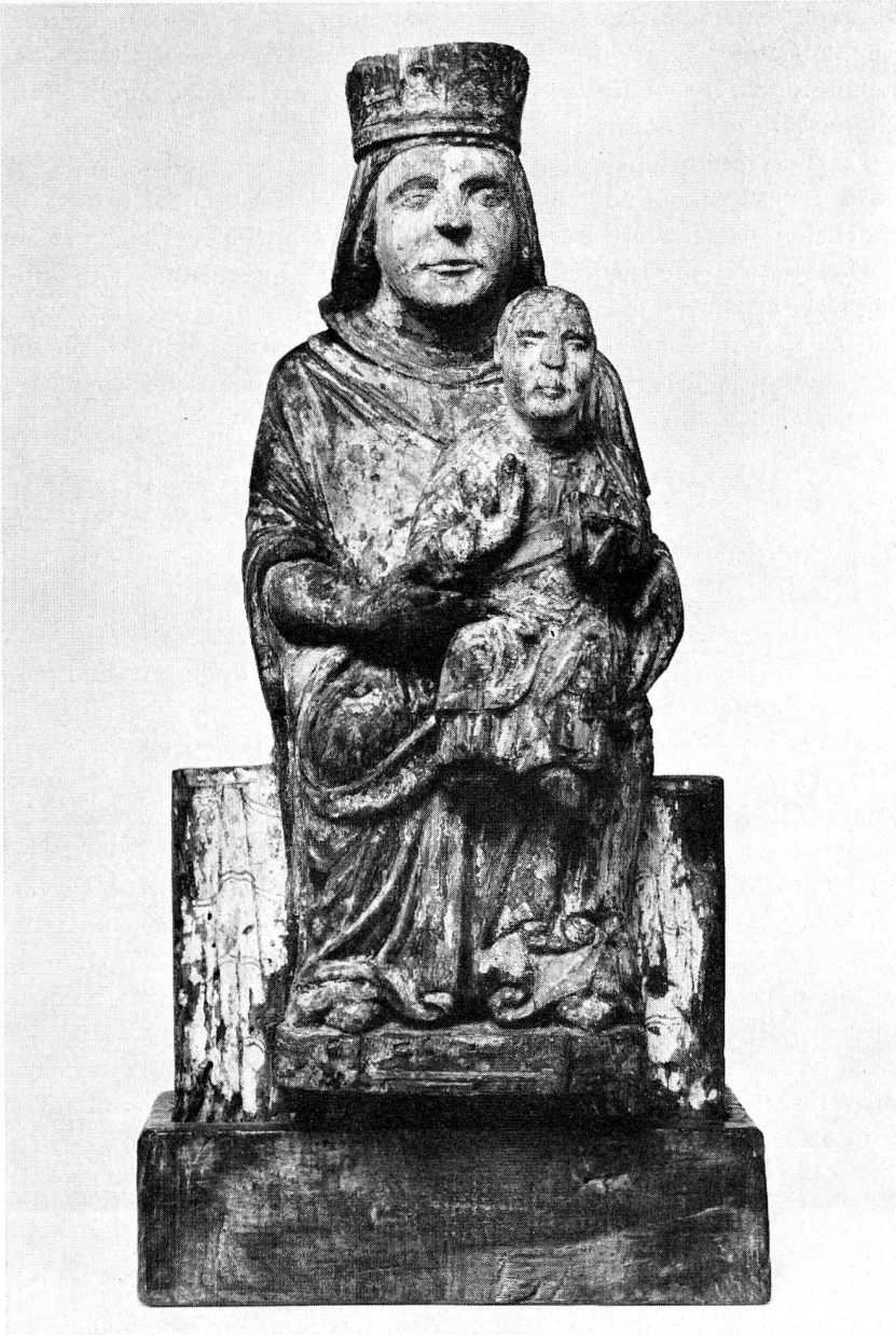
5. Madonna mit Kind. Pappelholz. Originale Fassung teilweise erhalten. 13. Jh. Höhe 48 cm (S. 22)

Meisen auf 26 913, was eine Gesamtzahl von 210 425 ergibt. Dieses schöne Resultat ist zum Teil auch den verlängerten Öffnungszeiten zuzuschreiben, die wir dank dem Verständnis der eidgenössischen Behörden am 1. Juli 1972 einführen konnten. Das Museum ist nun täglich von 10 bis 12 und von 14 bis 17 Uhr geöffnet, mit Ausnahme des Montagvormittags.