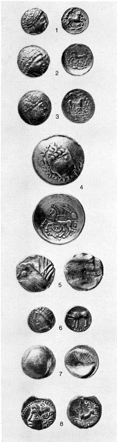
3. Keltische Münzen. Nat. Größe (S. 21, 62)