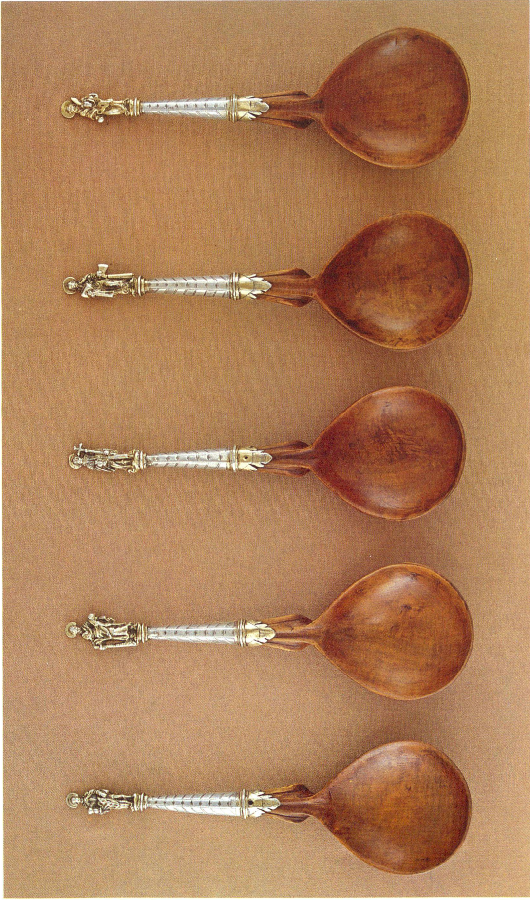
Apostellöffel. Laffen aus Buchsbaumholz, Stiele Silber, teilweise vergoldet. Wohl Zürich. 3. Viertel 17. Jh. Länge ca. 15,5 cm. (S. 29, 69)