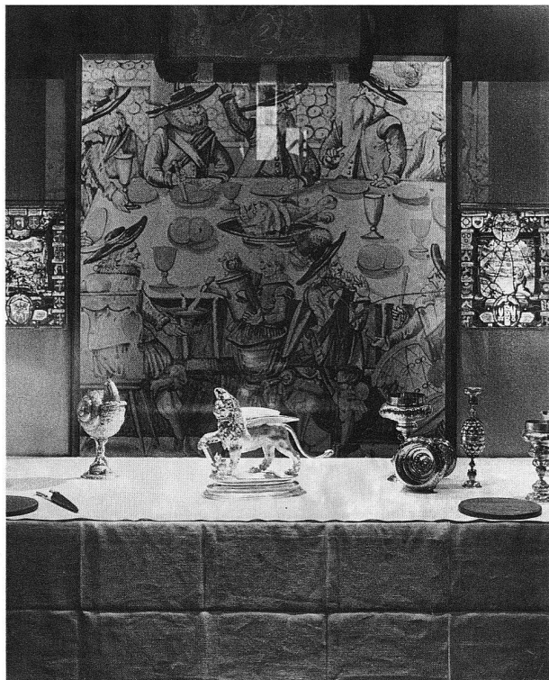
Abb. 2. Ausstellung «Ein Löwe aus Venedig». Gedeckter Tisch, Ausschnitt.

In der kleinen Ausstellung «Ein Löwe aus Venedig» steht das prachtvolle silberne Trinkgefäss im Zentrum einer rekonstruierten festlichen Tafel, wie sie am 25. April