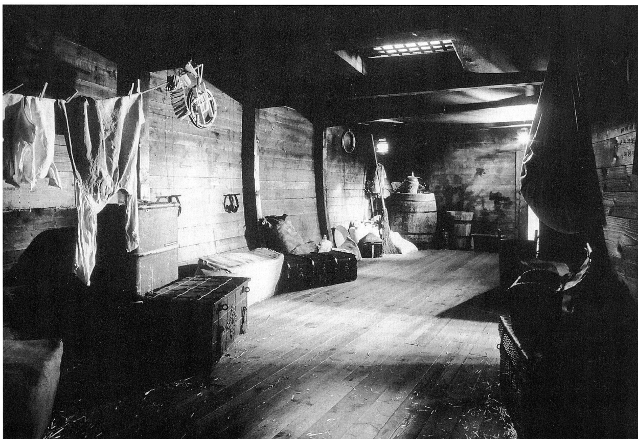
Abb. 3. Auswandererschiff in der Ausstellung 'Going West – Schweizer Volkskunst in Amerika'.

Den Abschluss der Ausstellungsreihe bildete die am 25. November eröffnete Schau 'Im Licht der Dunkelkammer – Die Schweiz in Photographien des 19. Jahr-