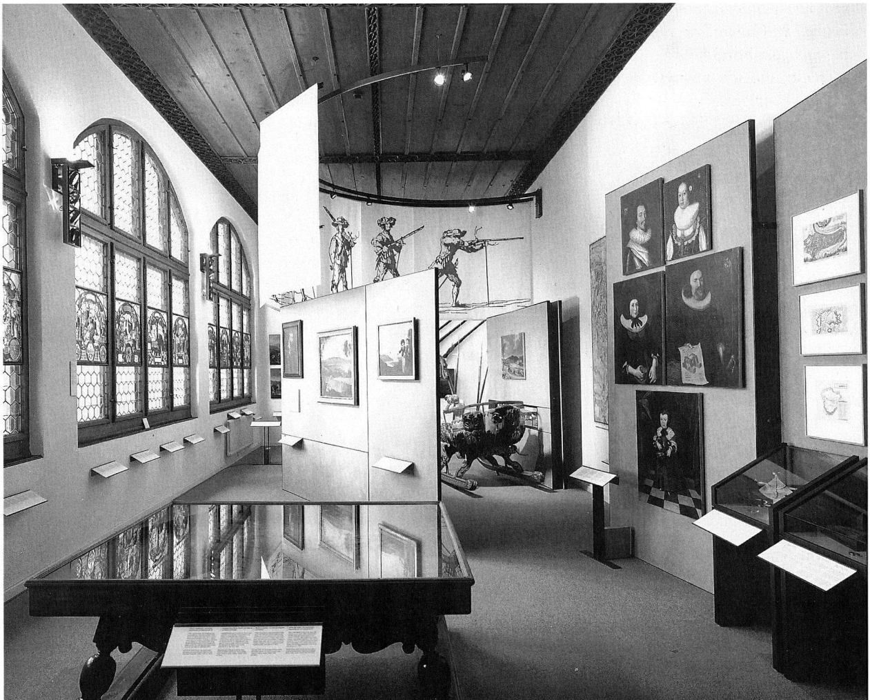
Abb. 4. Kulturgeschichtlicher Rundgang, Abschnitt «Stadt und Landschaft».

Eine bauliche Notsanierung, die vorrangig der Behebung statischer Mängel galt, musste in der ersten Jahreshälfte