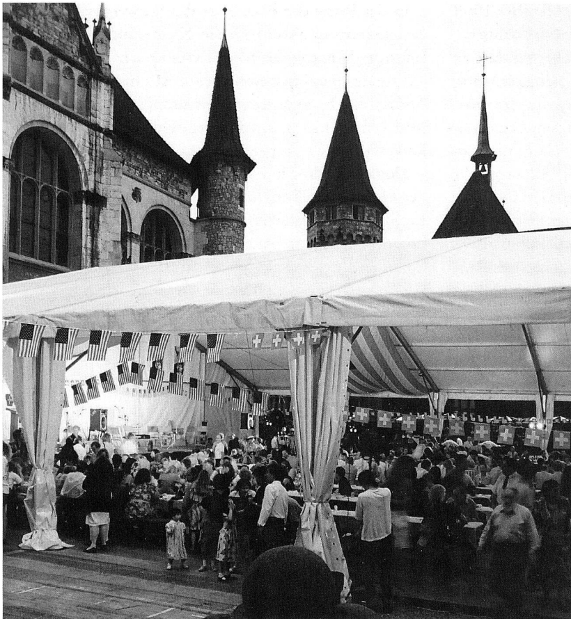
Abb. 1. Fest im Hof des Schweizerischen Landesmuseums zur Eröffnung der Ausstellung «Going West – Schweizer Volkskunst in Amerika».

veranstaltungen für Lehrkräfte aus verschiedenen Kantonen, die wir trotz dem stark reduzierten Angebot der Schausammlungen unverdrossen durchführten.