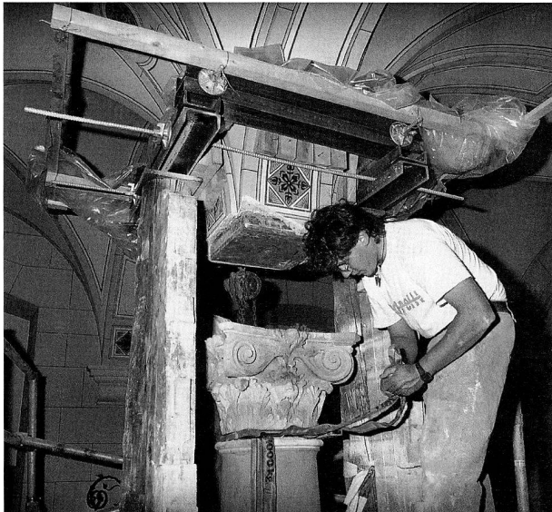
Abb. 4 Ausbau eines Kapitells in der Eingangshalle des Museums.

Peter Werhahn. Die Sammlung Werhahn umfasst 140 Münzen aus dem gesamten keltischen Raum. Das Ausstellungskonzept sah vor, eine geographisch geordnete Übersicht der keltischen Münzprägung zu präsentieren. Damit konnte die gesamte Werhahnsche Sammlung, ergänzt durch zahlreiche Prägungen aus der bedeutenden Sammlung keltischer Münzen des Münzkabinetts, ausgestellt werden. Angesichts der Vielfalt und Originalität der keltischen Münzen wurde bewusst eine sachliche und übersichtliche Gestaltung der Ausstellung angestrebt.