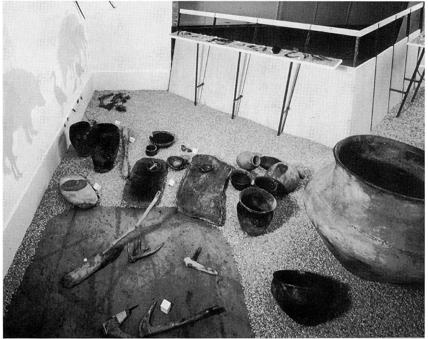
Abb. 3 Neueingerichtete prähistorische Dauerausstellung.

Peter Werhahn. Die Sammlung Werhahn umfasst 140 Münzen aus dem gesamten keltischen Raum. Das Ausstellungskonzept sah vor, eine geographisch geordnete Übersicht der keltischen Münzprägung zu präsentieren. Damit konnte die gesamte Werhahnsche Sammlung, ergänzt durch zahlreiche Prägungen aus der bedeutenden Sammlung keltischer Münzen des Münzkabinetts, ausgestellt werden. Angesichts der Vielfalt und Originalität der keltischen Münzen wurde bewusst eine sachliche und übersichtliche Gestaltung der Ausstellung angestrebt.