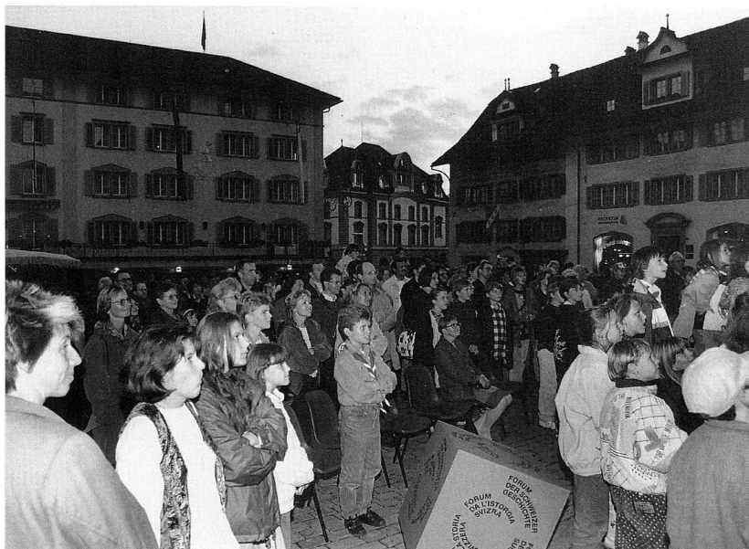
Abb. 1 Eröffnung des Forums der Schweizer Geschichte in Schwyz, Festakt auf dem Dorfplatz.

Vertreterinnen und Vertretern aus Politik, Wirtschaft, Wissenschaft, Kultur und zahlreichen Zuhörern aus der ganzen Schweiz. Am Eröffnungswochenende überzeugten sich gut 5'000 Besucherinnen und Besucher von den Vorzügen dieses modernen Museums und «Forums» für verschiedenste Aktivitäten, aber auch von der Freude der Einheimischen, die in den Festwirtschaften auf Plätzen und in Höfen des Zentrums von Schwyz ihren Stolz über ihre neueste Kulturstätte zeigten. Dem spontan guten Echo aus der engeren Region folgte später auch die breite Zustimmung aus den übrigen Landesteilen,